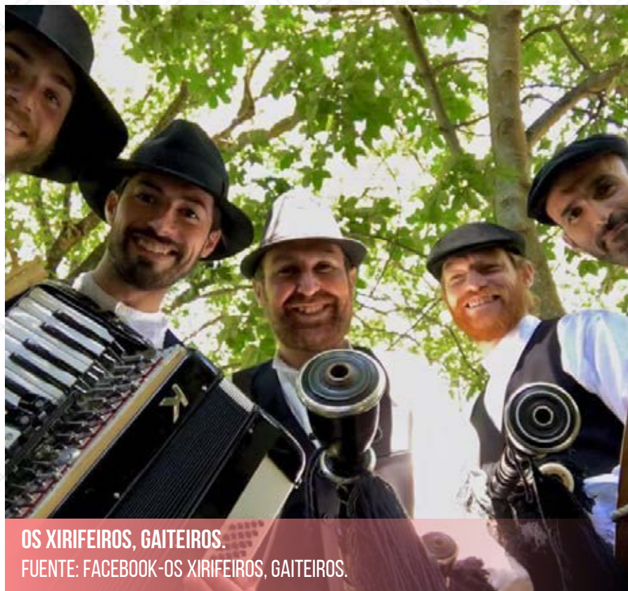
OS XIRIFEIROS, GAITEIROS.