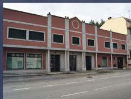
Tanatorio Boiro Carrofeito n.º 8 - Cimadevila 981 848 322