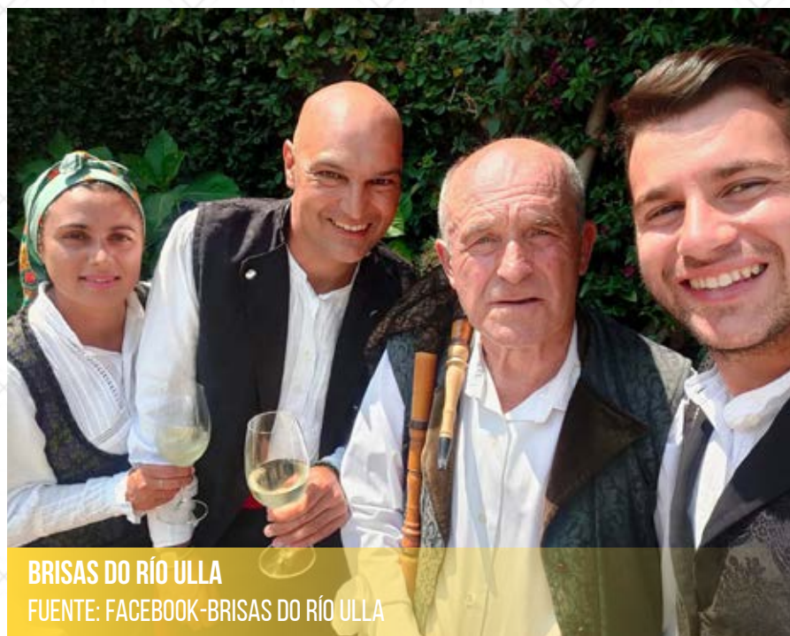
BRISAS DO RÍO ULLA