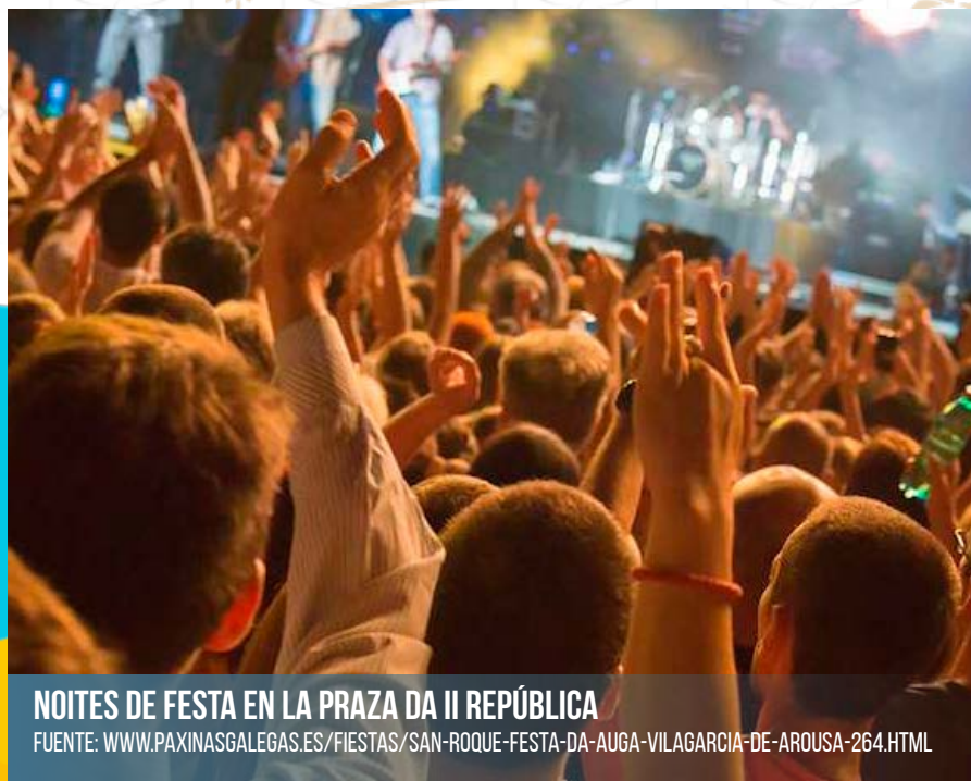
NOITES DE FESTA EN LA PRAZA DA II REPÚBLICA