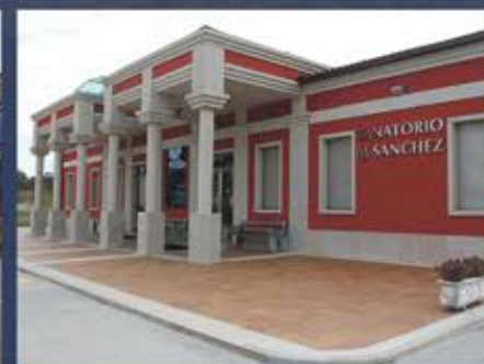
Tanatorio Rianxo O Pazo n.º 86 - Rianxo 981 862 089