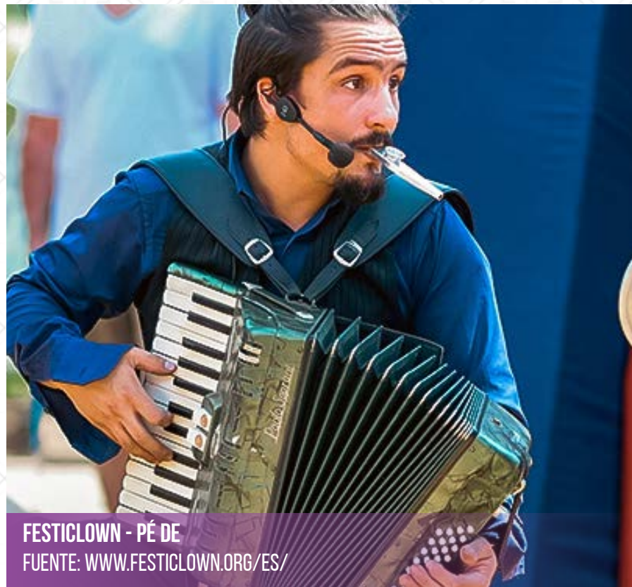
FESTICLOWN - PÉ DE FUENTE: WWW.FESTICLOWN.ORG/ES/