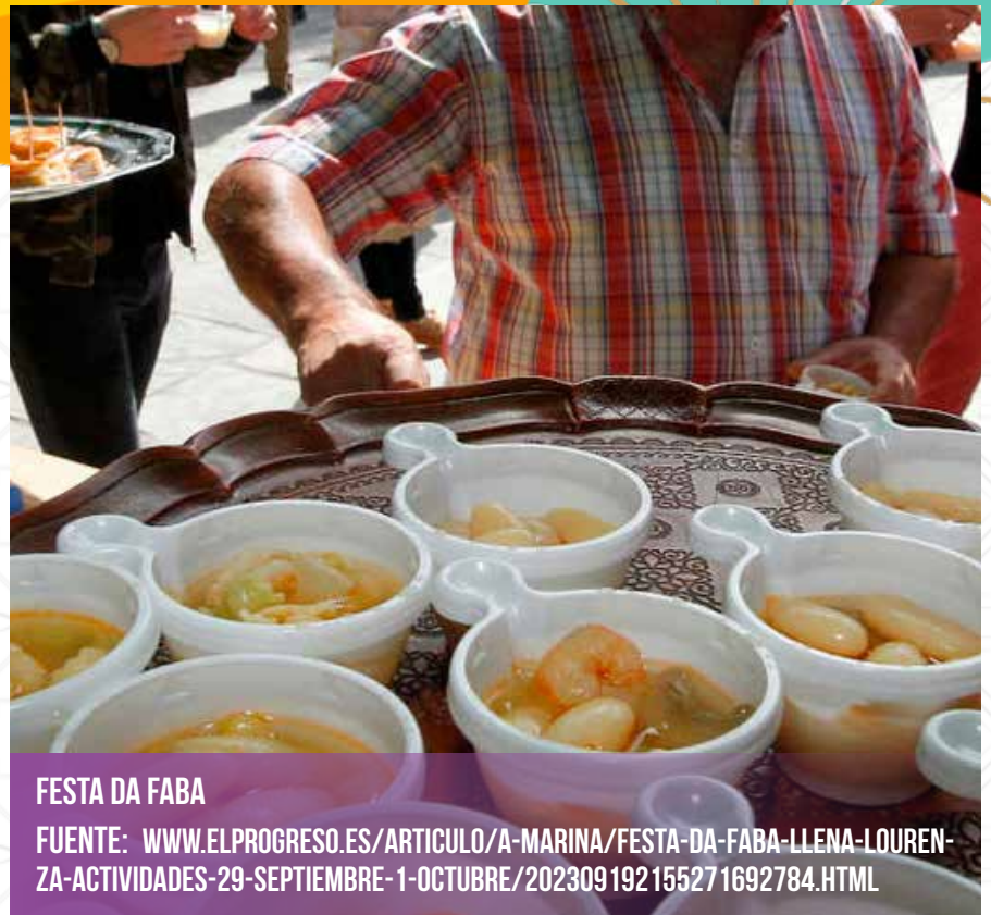
FESTA DA FABA