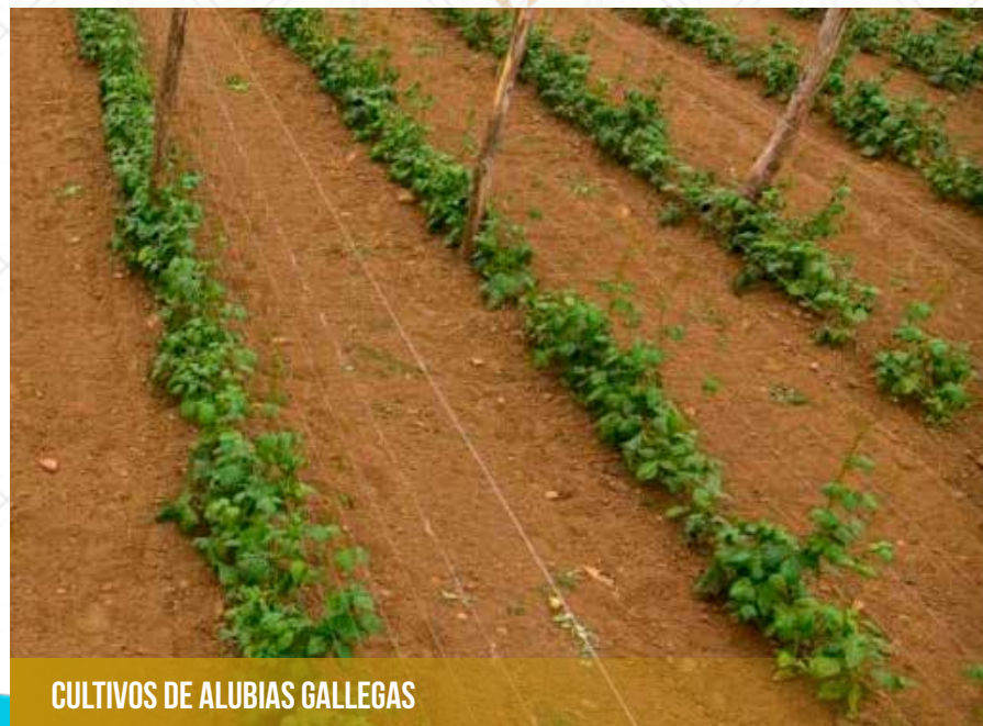
CULTIVOS DE ALUBIAS GALLEGAS