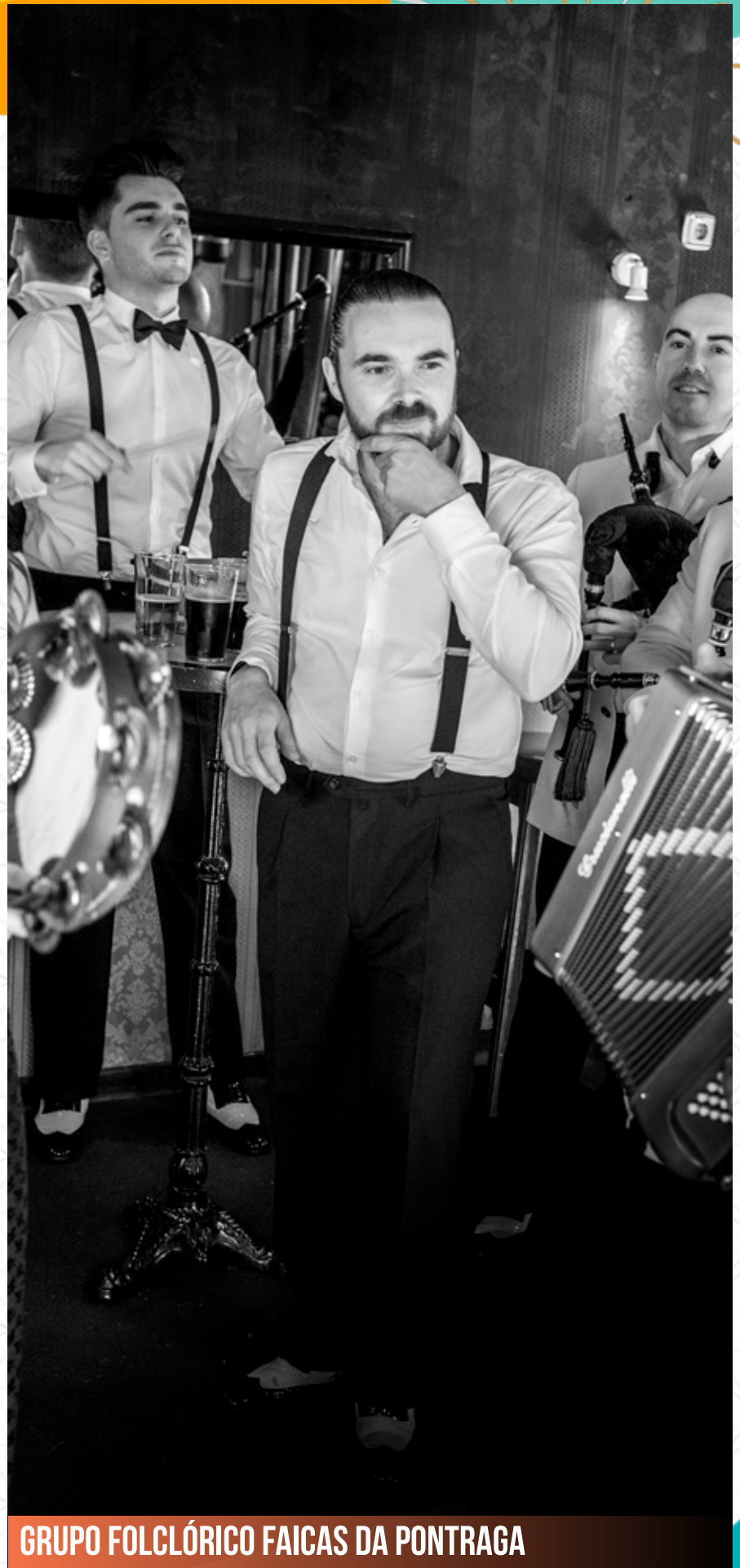
GRUPO FOLCLÓRICO FAISCAS DA PONTRAGA