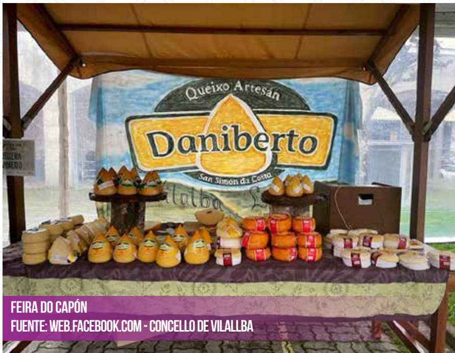
FEIRA DO CAPÓN