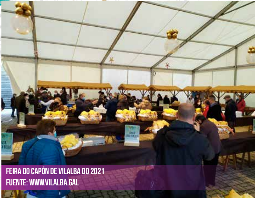
FEIRA DO CAPÓN DE VILALBA DO 2021