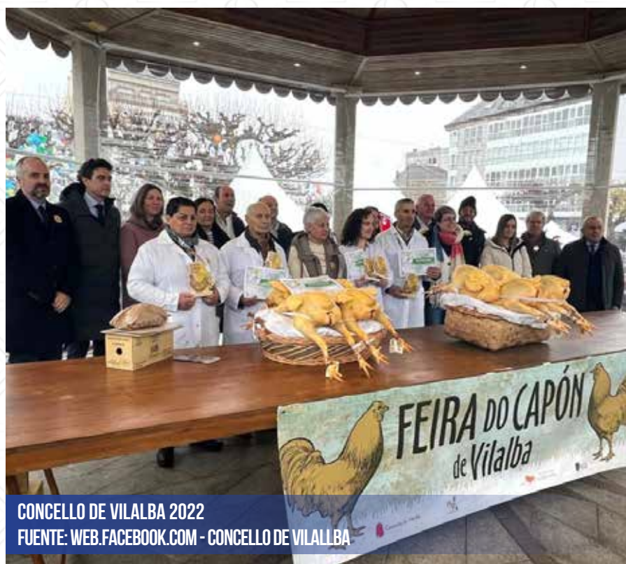
CONCELLO DE VILALBA 2022