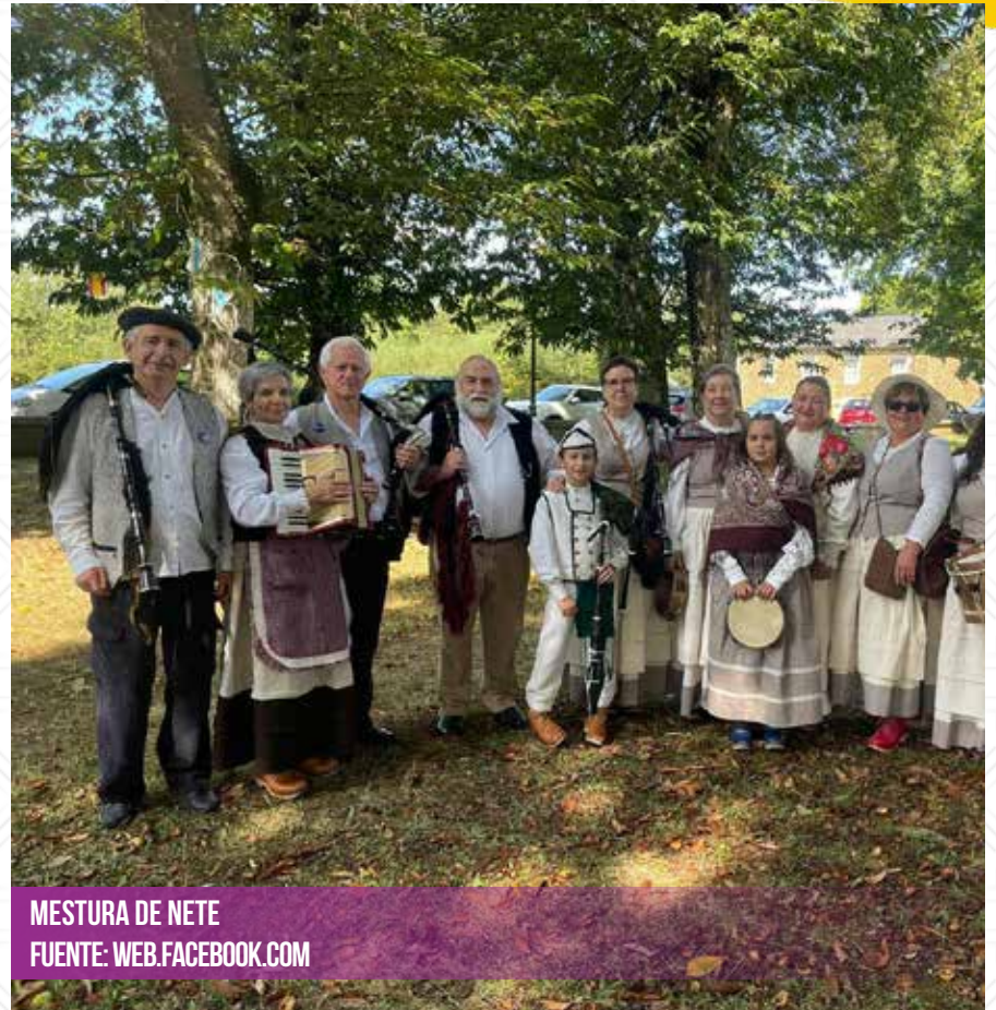
MESTURA DE NETE