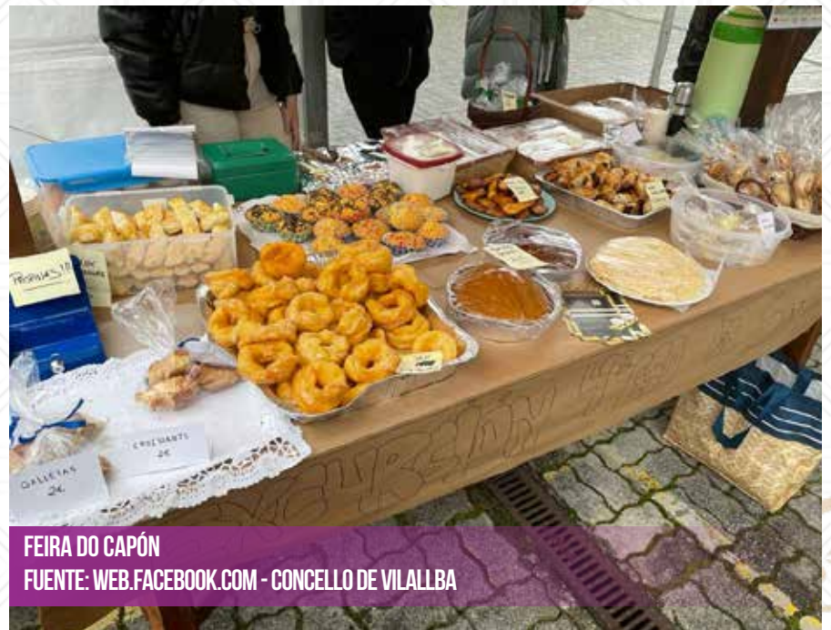
FEIRA DO CAPÓN