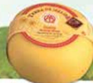
Queso Arzúa Ulloa

Orois - Melide (A Coruña) Tlf. 981 80 80 09