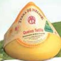
Queso tetilla "Terra de Melide"

Distinguida con 26 premios nacionales y regionales