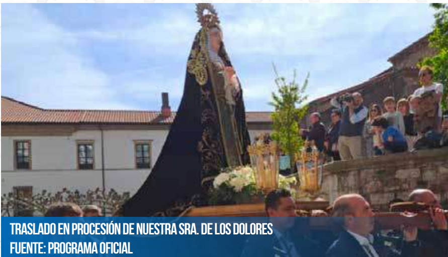
TRASLADO EN PROCESIÓN DE NUESTRA SRA. DE LOS DOLORES