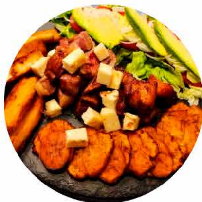
Entrecot y cochino frito