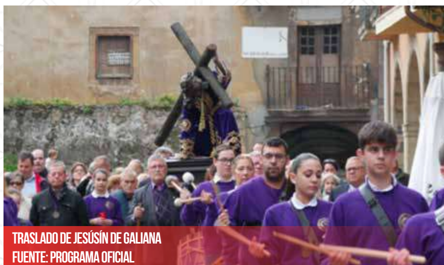
TRASLADO DE JESÚSÍN DE GALIANA FUENTE: PROGRAMA OFICIAL

Recital de Vía Crucis de Gerardo Diego. Se trata de un Vía Crucis que narra en verso los momentos más dolorosos de la Pasión de Cristo. La Cofradía de Nuestro Padre Jesús de la Esperanza lo organiza cada año para conmemorar el sacrificio de Jesús por la humanidad.