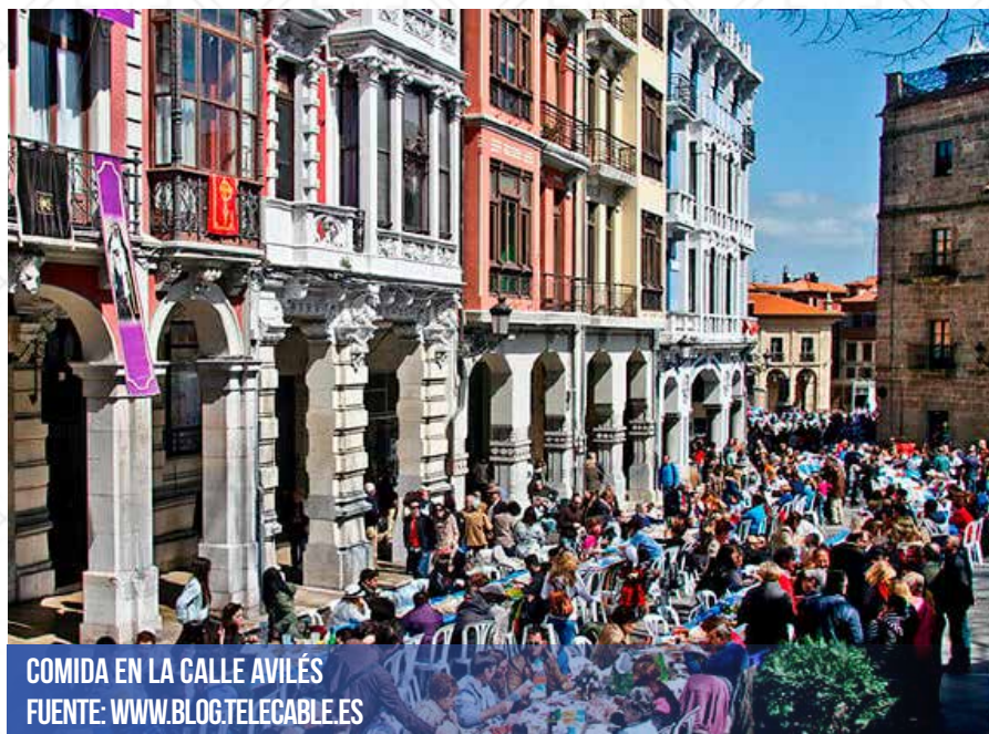
COMIDA EN LA CALLE AVILÉS