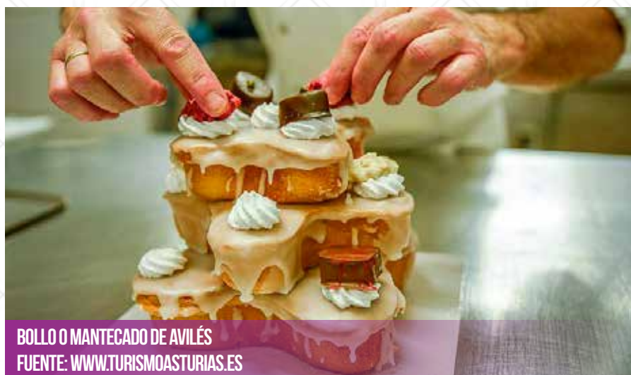
BOLLO O MANTECADO DE AVILÉS

La realización de la preinscripción telemática no supone la reserva de las plazas solicitadas, siendo necesario en todos los casos acudir presencialmente a la Antigua Pescadería a confirmar la inscripción en el día y hora indicados.