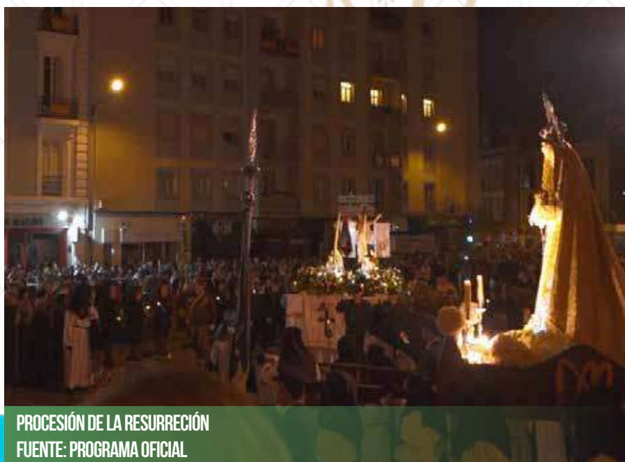
PROCESIÓN DE LA RESURRECCIÓN