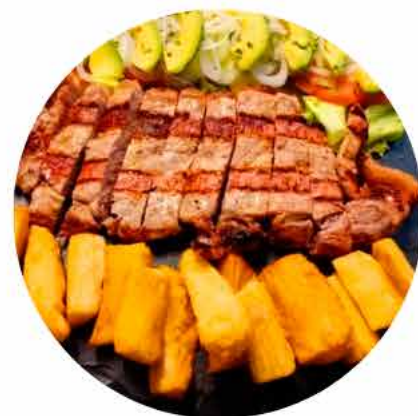
Tabla trinchado ternera