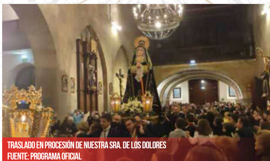
TRASLADO EN PROCESIÓN DE NUESTRA SRA. DE LOS DOLORES