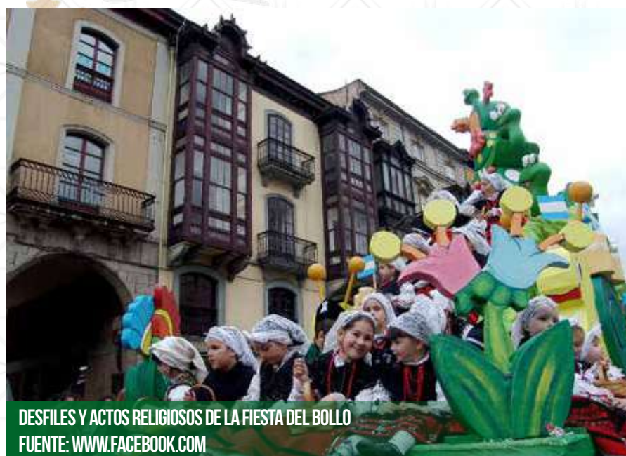
DESFILES Y ACTOS RELIGIOSOS DE LA FIESTA DEL BOLLO