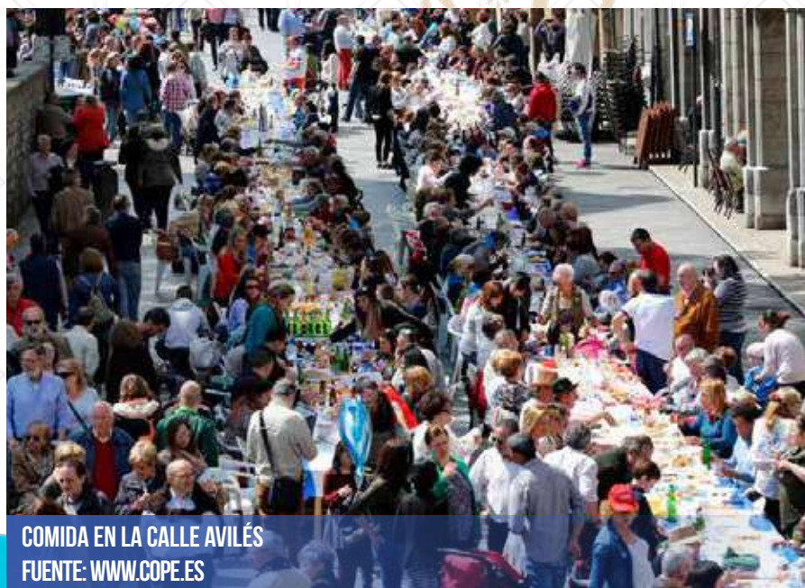
COMIDA EN LA CALLE AVILÉS