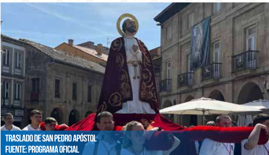
TRASLADO DE SAN PEDRO APÓSTOL