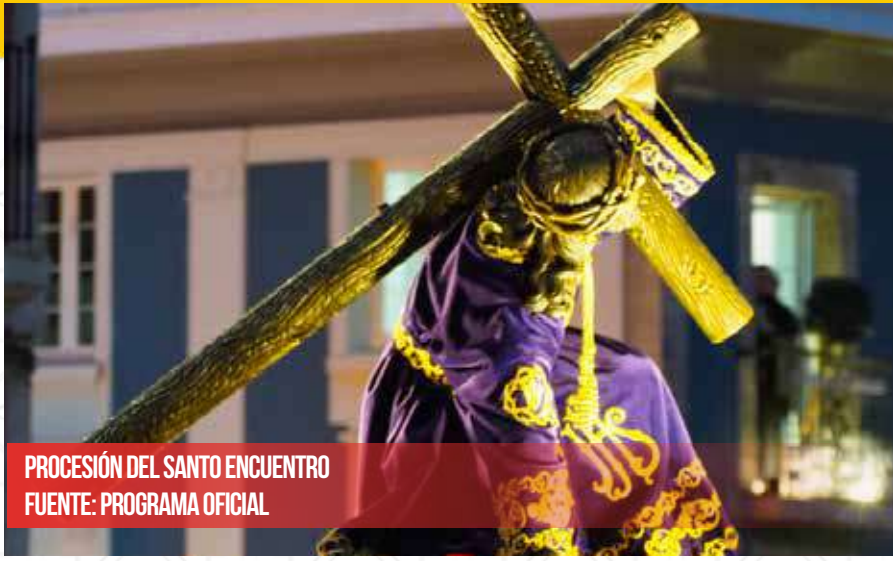
PROCESIÓN DEL SANTO ENCUENTRO