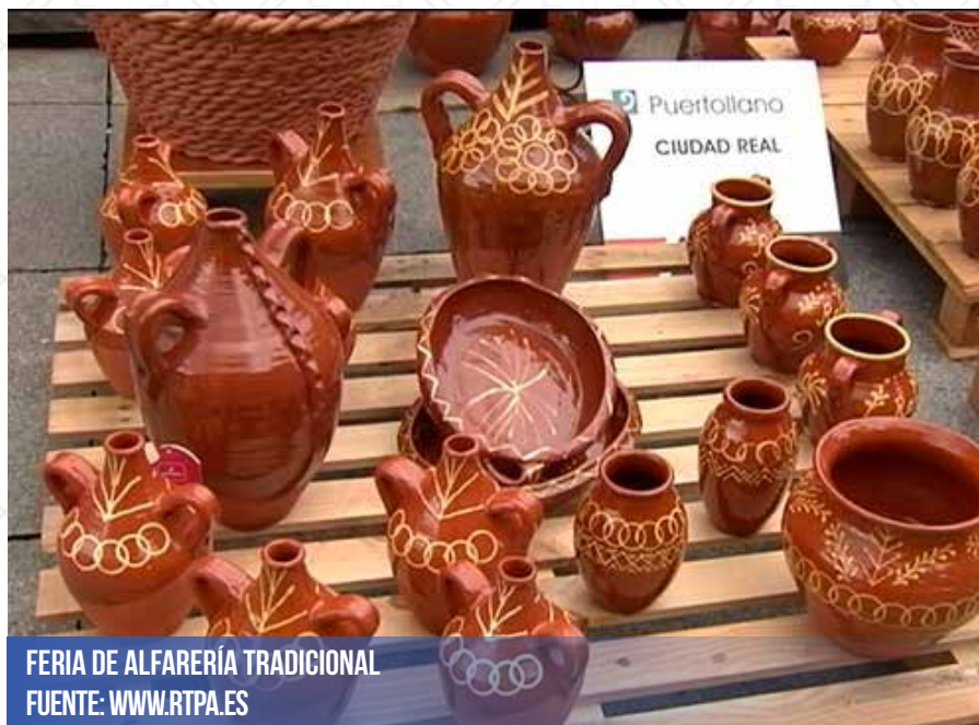
FERIA DE ALFARERÍA TRADICIONAL