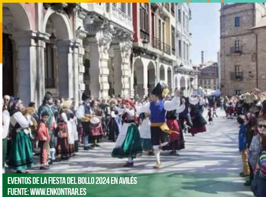
EVENTOS DE LA FIESTA DEL BOLLO 2024 EN AVILÉS

Los espacios destinados para la Comida en la Calle ya están definidos, atravesando el casco histórico y creando una atmósfera única para disfrutar de esta tradición gastronómica.