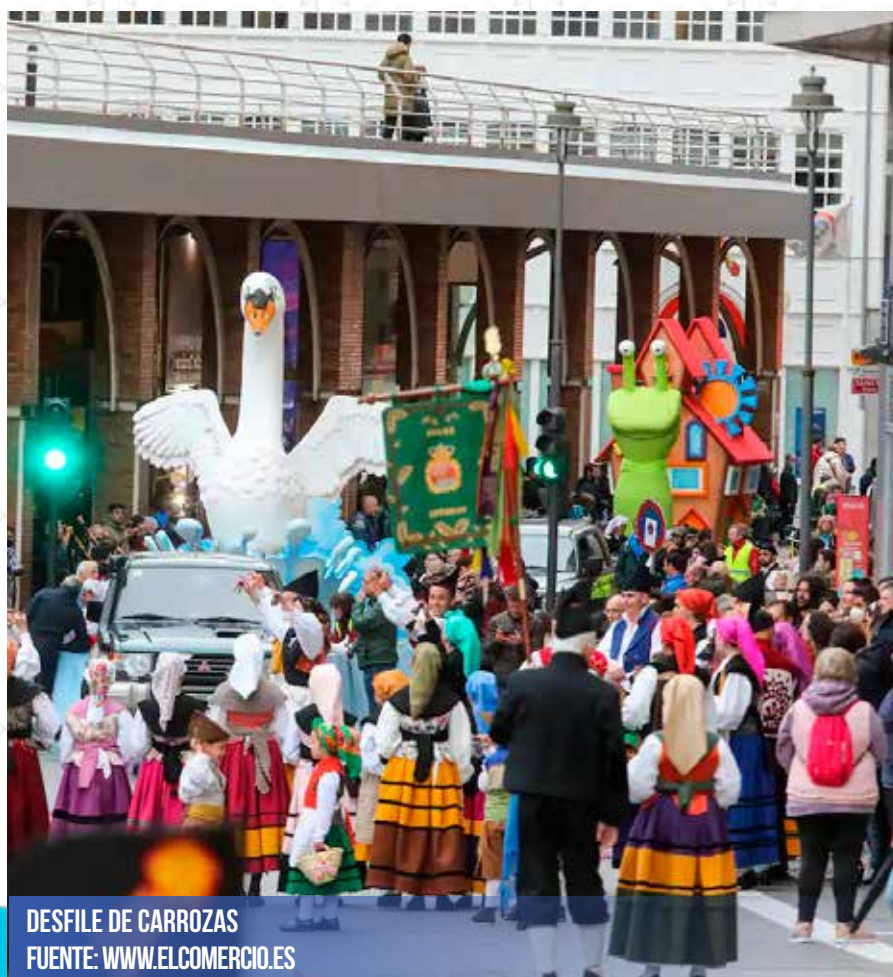
DESFILE DE CARROZAS