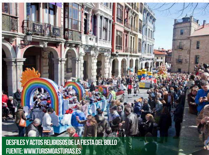
DESFILES Y ACTOS RELIGIOSOS DE LA FIESTA DEL BOLLO