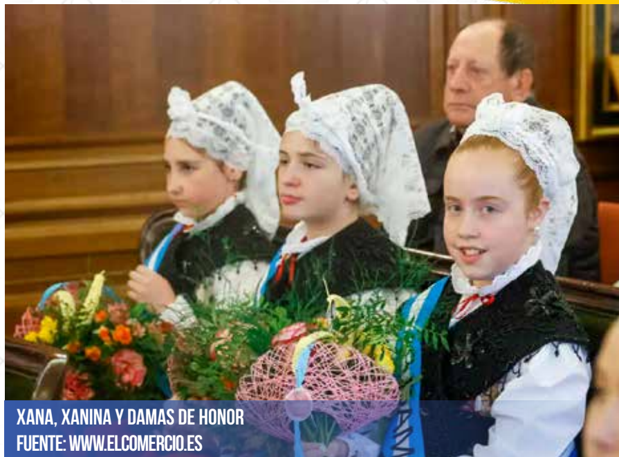
XANA, XANINA Y DAMAS DE HONOR

23.30 HORAS.- Verbena de "El Bollo". Contará con la participación de la orquesta Charleston Big Band Lugar: Pista de la Exposición (Las Meanas)