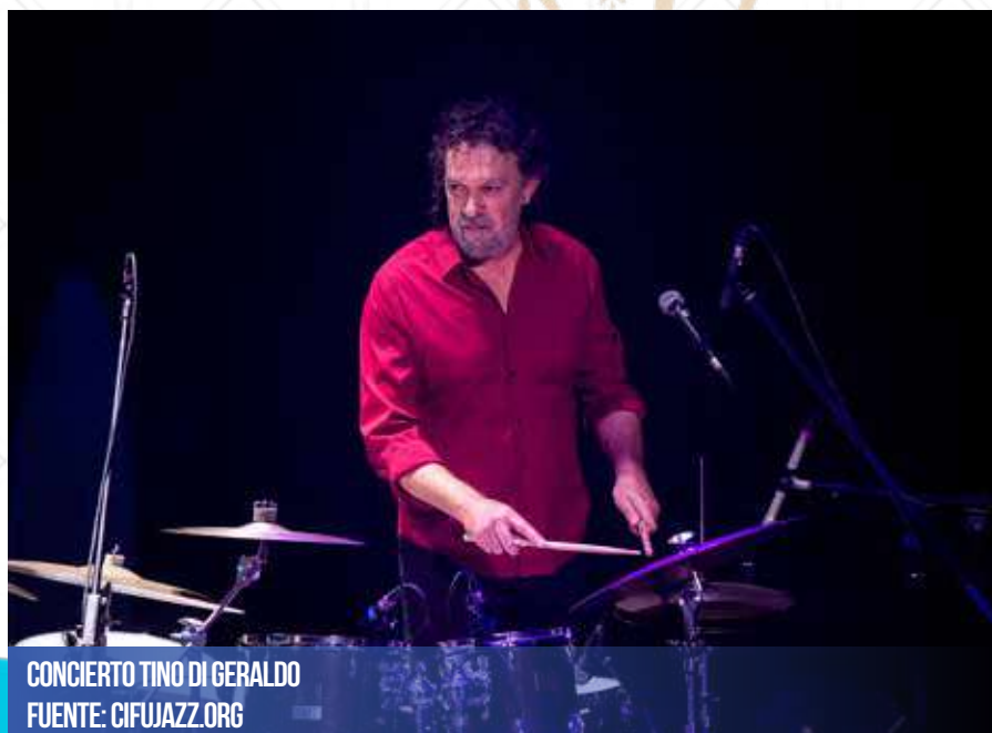
CONCIERTO TINO DI GERALDO