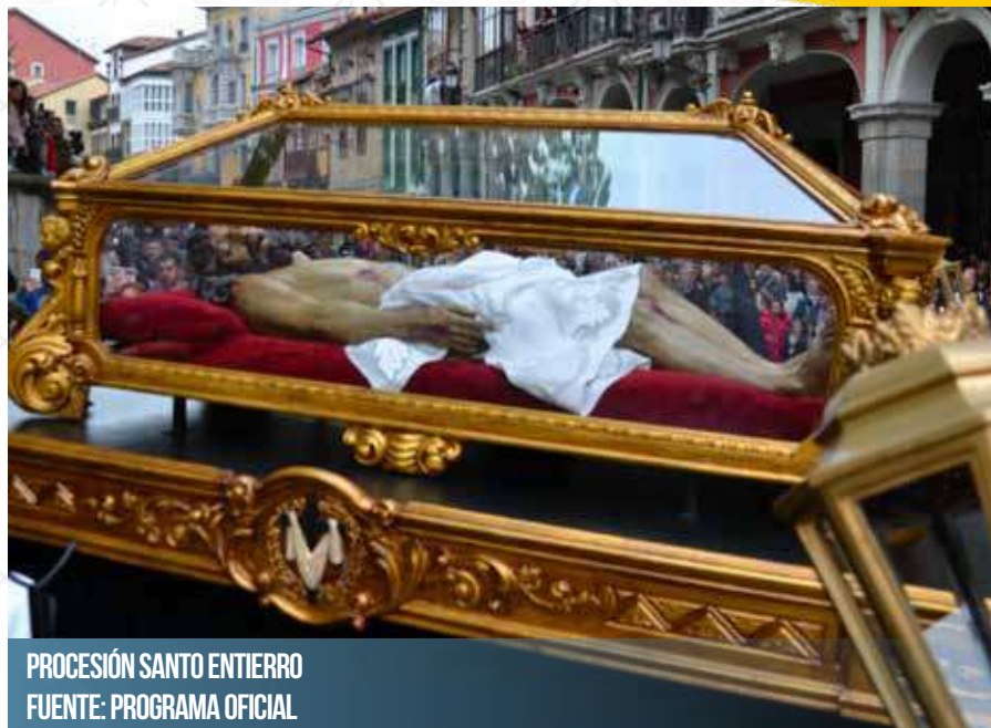
PROCESIÓN SANTO ENTIERRO

Plaza de la Merced, La Cámara, La Fruta, Cuesta de la Molinera, Plaza de Pedro Menéndez, La Estación, Plaza del Carbayo (canto de la Salve Marinera y Estrella de los Mares), Marcos del Torniello, Plaza de la Merced (Salve Popular) y Calle Cuba.