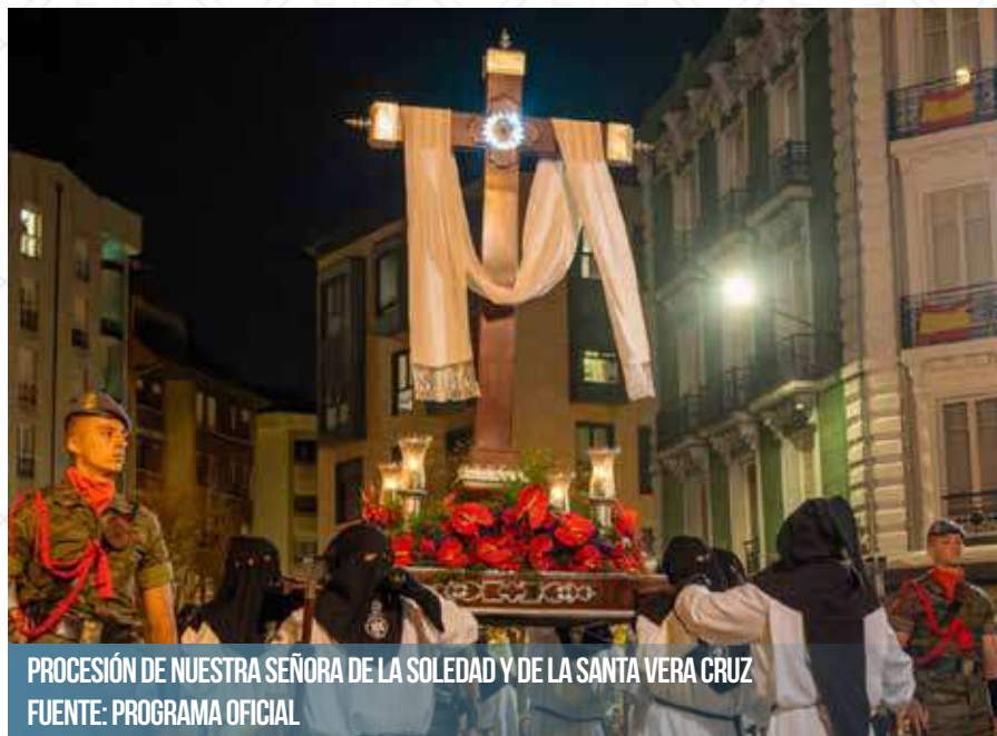
PROCESIÓN DE NUESTRA SEÑORA DE LA SOLEDAD Y DE LA SANTA VERA CRUZ