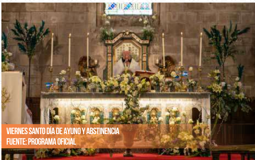
VIERNES SANTO DÍA DE AYUNO Y ABSTINENCIA

El lunes 1 de abril, lunes de Pascua, se suspenden todas las celebraciones debido a la tradicional comida en la calle y la imposibilidad de acceder al edificio.