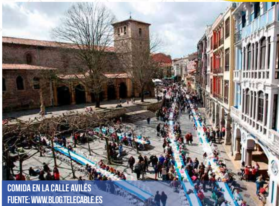
COMIDA EN LA CALLE AVILÉS

La Fiesta del Bollo tiene sus raíces en el siglo XIX, siendo una manifestación de convivencia y participación popular que marca la llegada de la primavera y el fin del ayuno pascual. Se celebra en el Domingo de Ramos y el Lunes de Pascua, sirviendo como un cierre festivo para la Semana Santa.