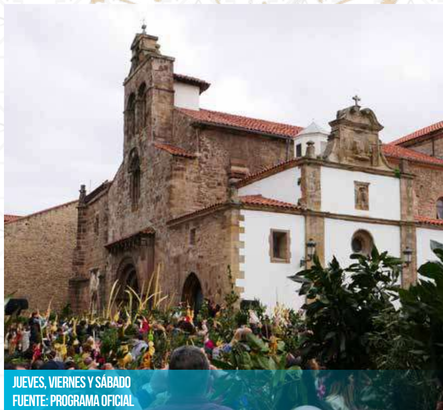
JUEVES, VIERNES Y SÁBADO FUENTE: PROGRAMA OFICIAL