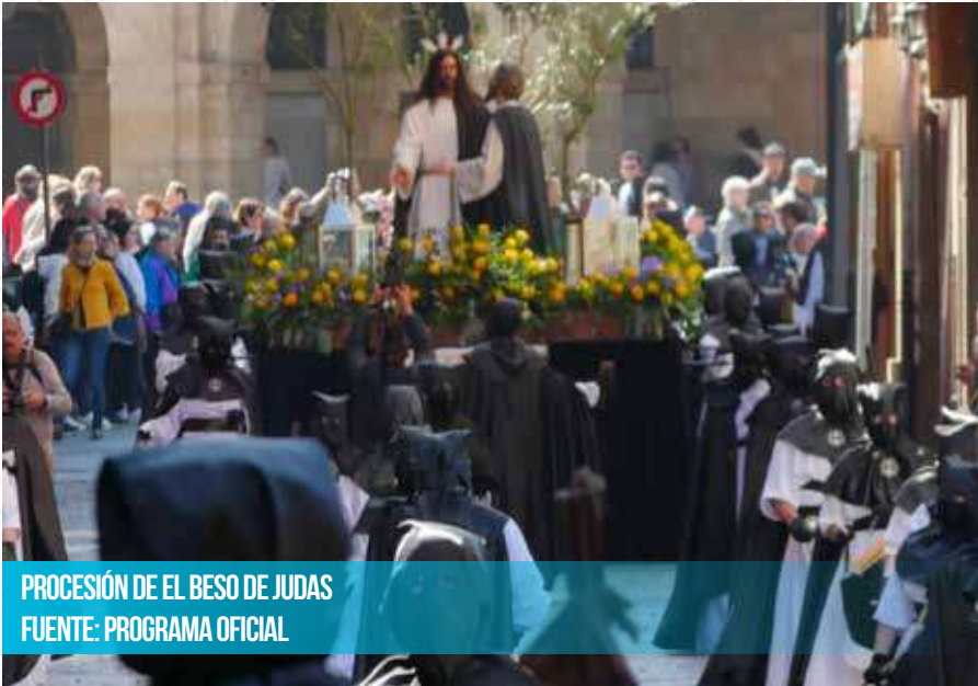
PROCESIÓN DE EL BESO DE JUDAS