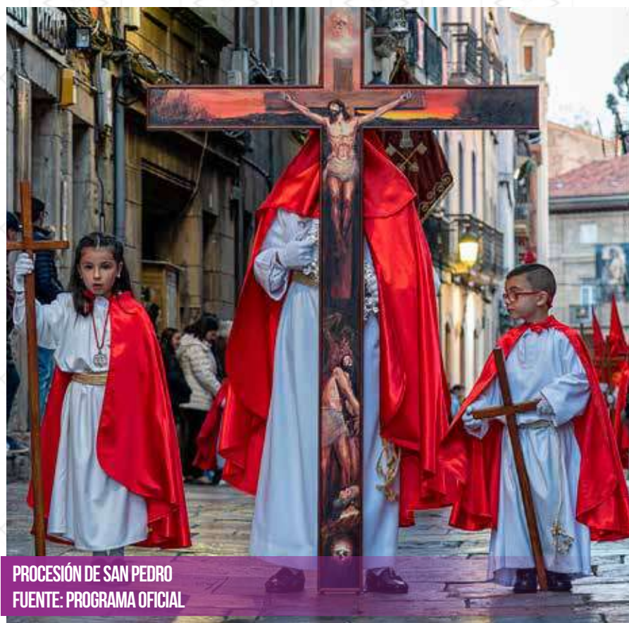
PROCESIÓN DE SAN PEDRO

Recorrido: Rivero, Plaza de España, La Ferrería, Campo-sagrado donde se pronunciará el Sermón, San Bernardo, La Fruta, Plaza de España y Rivero.