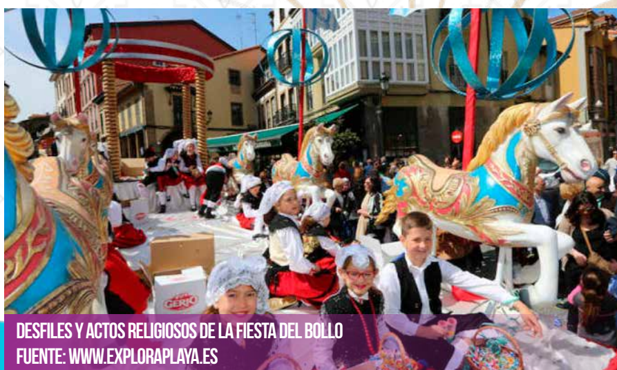
DESFILES Y ACTOS RELIGIOSOS DE LA FIESTA DEL BOLLO