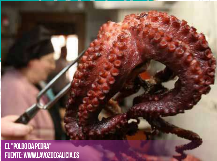
EL "POLBO DA PEDRA"