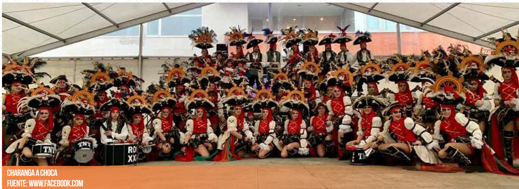
CHARANGA A CHOCA