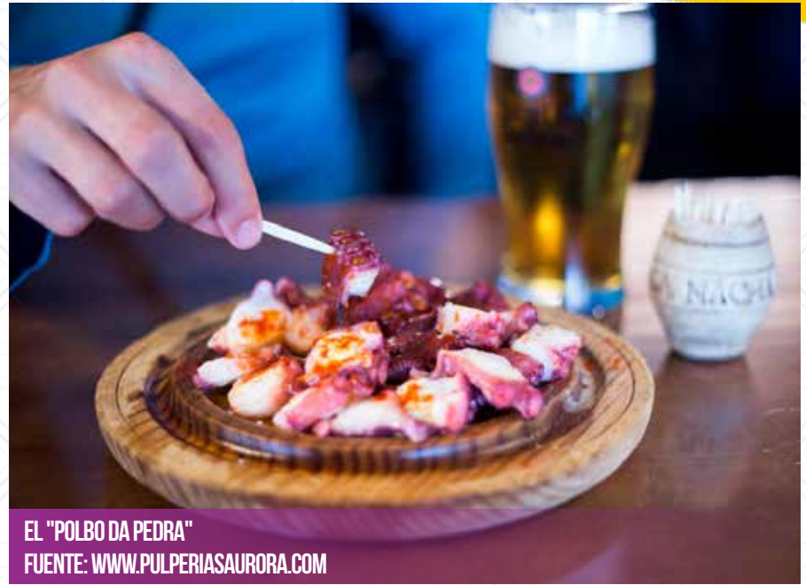
EL "POLBO DA PEDRA"