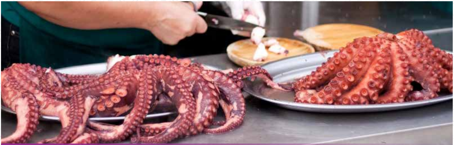
EL "POLBO DA PEDRA"