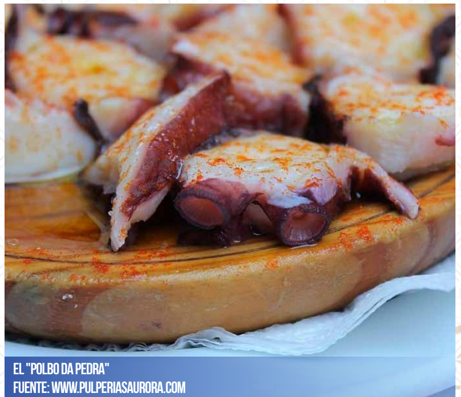
EL "POLBO DA PEDRA"