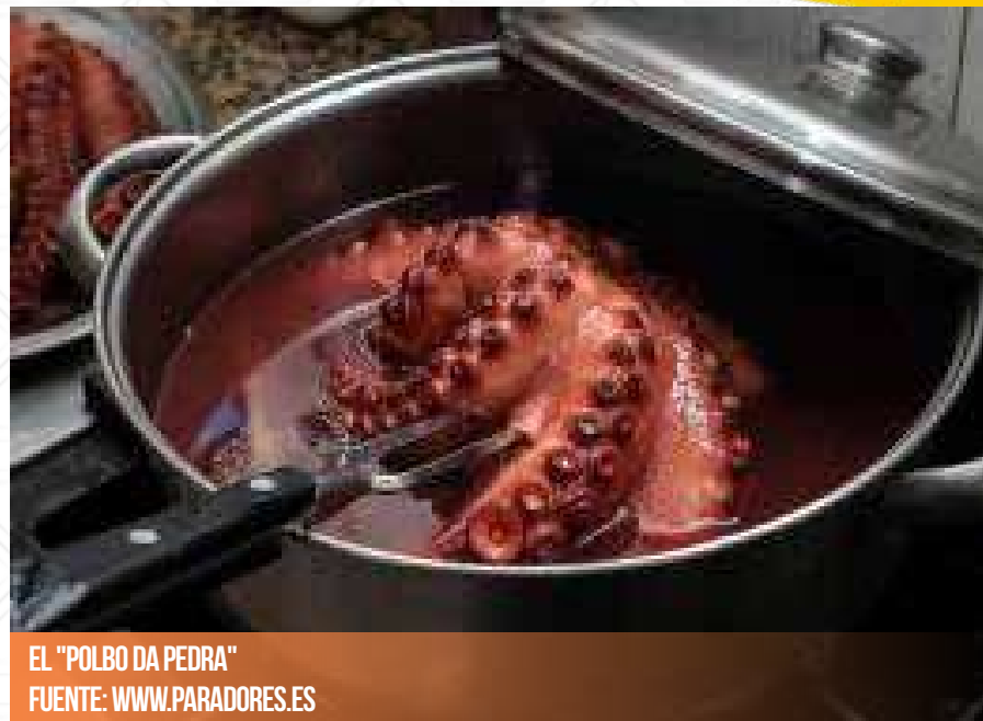
EL "POLBO DA PEDRA"

de Xove, ha cumplido ya su XIX edición. Durante el Jueves Santo los bares y restaurantes de Xove dedican la jornada a preparar diferentes recetas con el apreciado polbo (pulpo). El "polbo da pedra" es un pulpo de la costa lucense con unas características peculiares: más oscuro, con tentáculos más largos y la cabeza más pequeña. La fiesta comienza por la tarde y el pulpo se cocina de diferentes maneras, siendo amenizado por música tradicional. En un radio de 97 kilómetros te esperan los Paradores de Ribadeo, Vilalba y Ferrol.