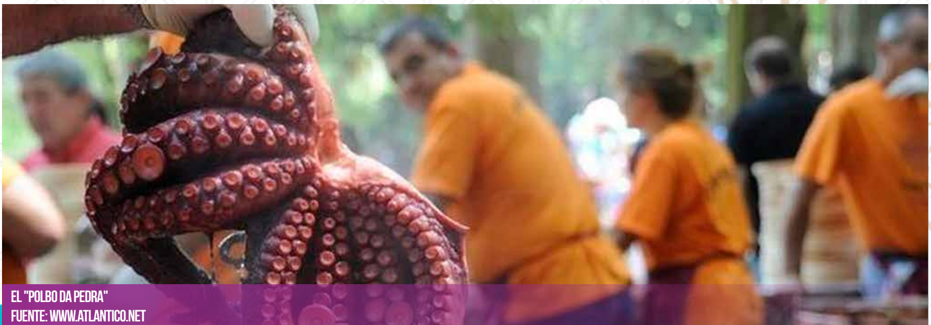
EL "POLBO DA PEDRA"