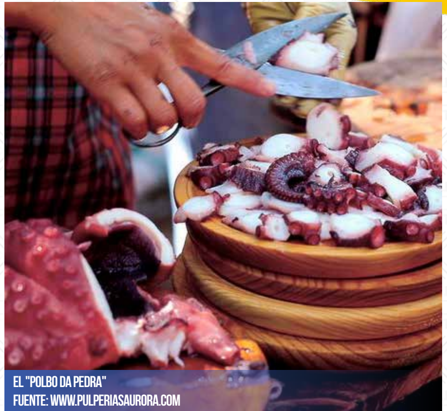
EL "POLBO DA PEDRA"

Esta fiesta gastronómica organizada por los hosteleros