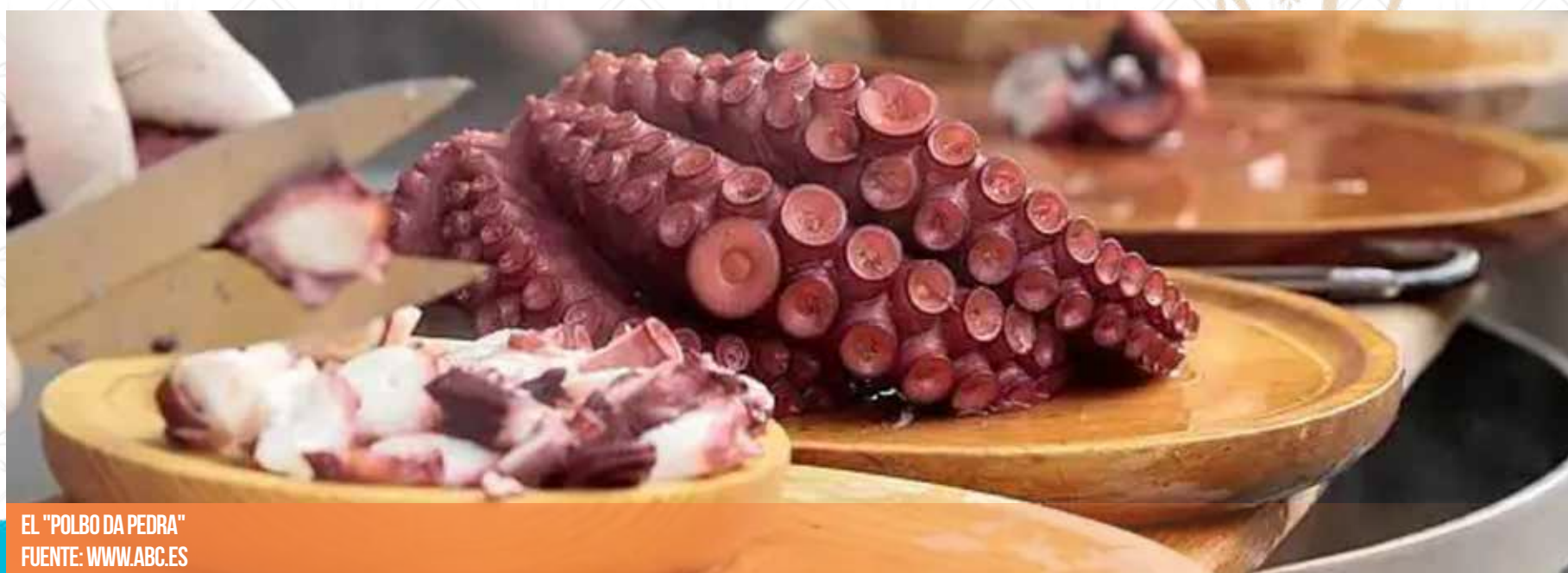
EL "POLBO DA PEDRA"