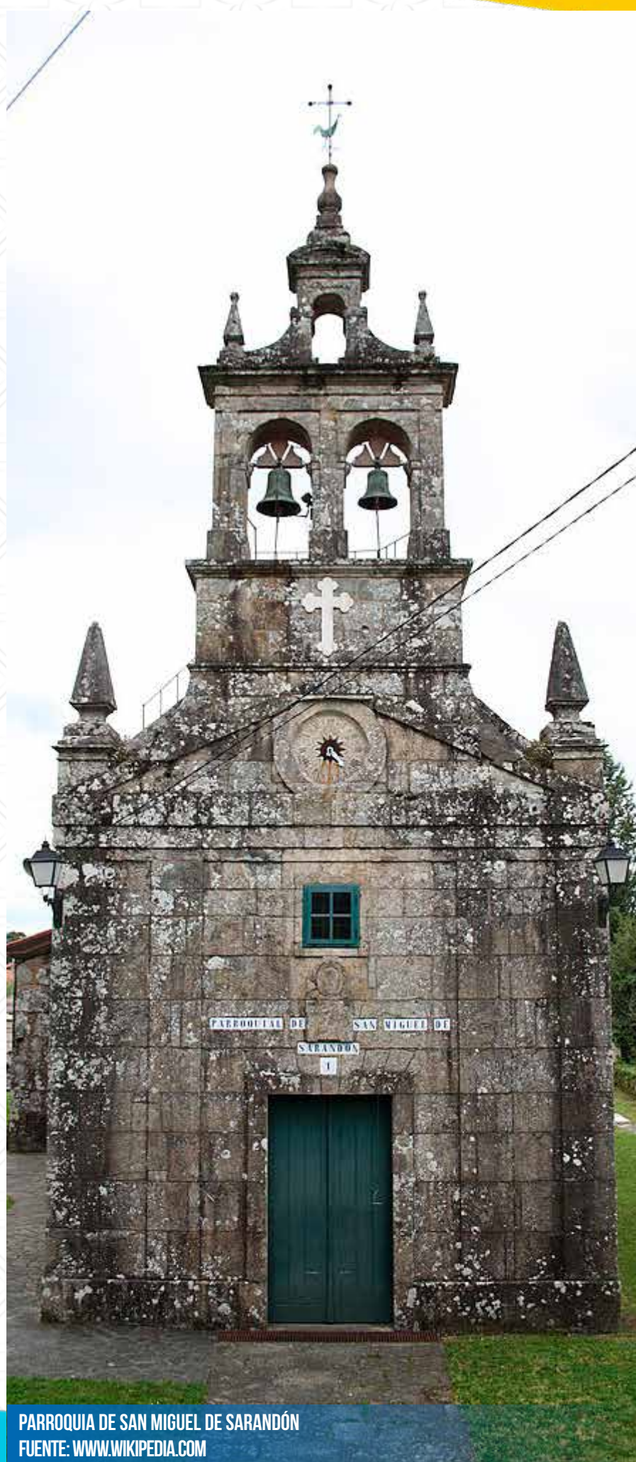
PARROQUIA DE SAN MIGUEL DE SARANDÓN