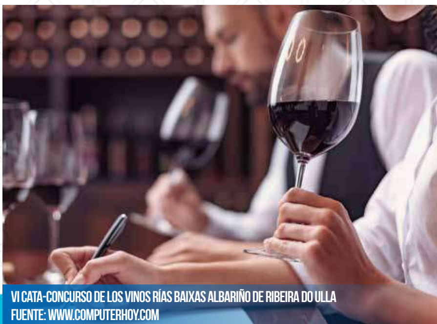
VI CATA-CONCURSO DE LOS VINOS RÍAS BAIXAS ALBARIÑO DE RIBEIRA DO ULLA

En el Campo da Feira de San Miguel de Sarnadón se procederá a la apertura de la muestra de los vinos y a la apertura de los concellos de la subzona, y los presentes podrán disfrutar en Harmonía con la cata de vinos y tapas.