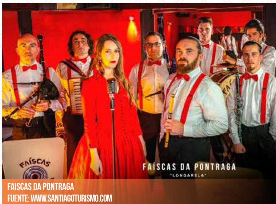
FAISCAS DA PONTRAGA

La parroquia de San Miguel de Sarandón, en el municipio de Vedra, celebrará su tradicional Fiesta de Exaltación do Viño da Ulla, jornada que servirá para promocionar este exquisito vino de la zona, que con su sabor y aroma deleita a los más exquisitos paladares.