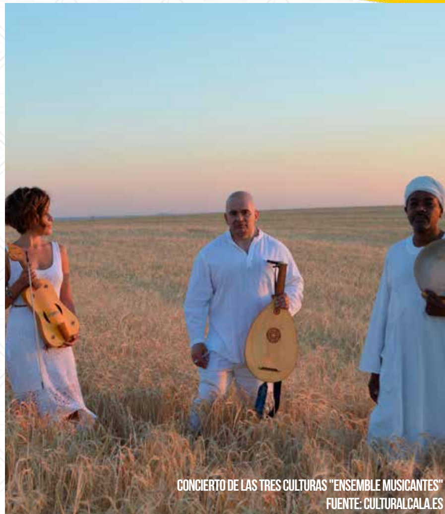
CONCIERTO DE LAS TRES CULTURAS "ENSEMBLE MUSICANTES"

Concierto de las Tres Culturas "Ensemble Musicantes" en el Teatro Cervantes. Entradas: 10 €.