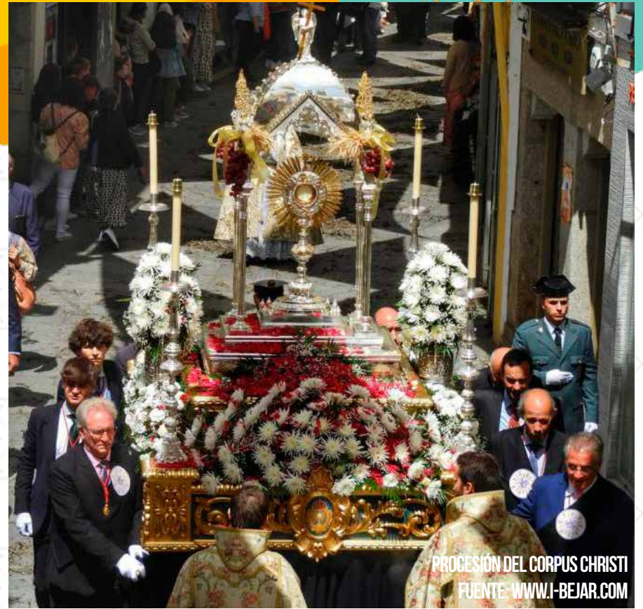
PROCESIÓN DEL CORPUS CHRISTI

A lo largo del recorrido podrán contemplarse los altares de las Cofradías y Hermandades, los adornos florales tradicionales y los escaparates. Con intervención de la Banda Municipal de Música y Coral de Béjar.