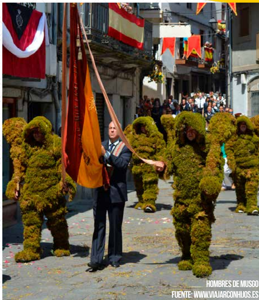
HOMBRES DE MUSGO