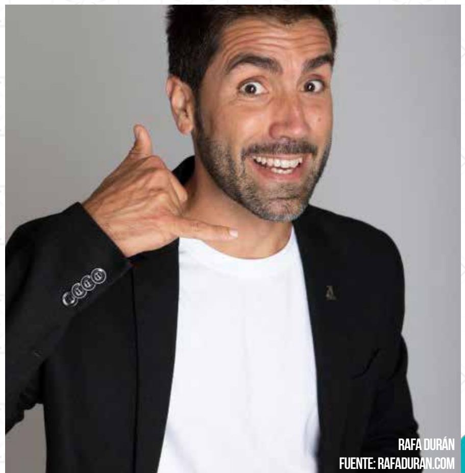
RAFA DURÁN FUENTE: RAFADURAN.COM