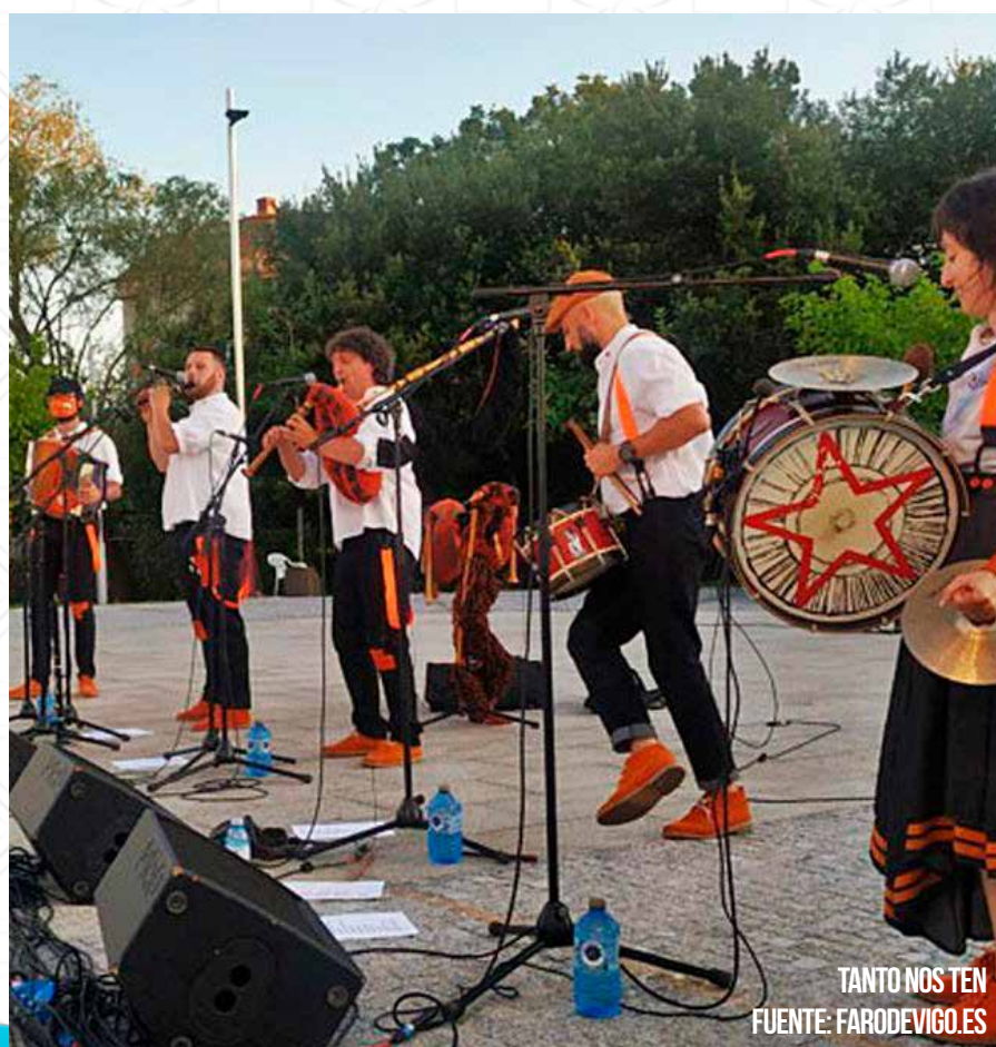
TANTO NOS TEN

será el turno del concierto U2 Zen Garden, concierto