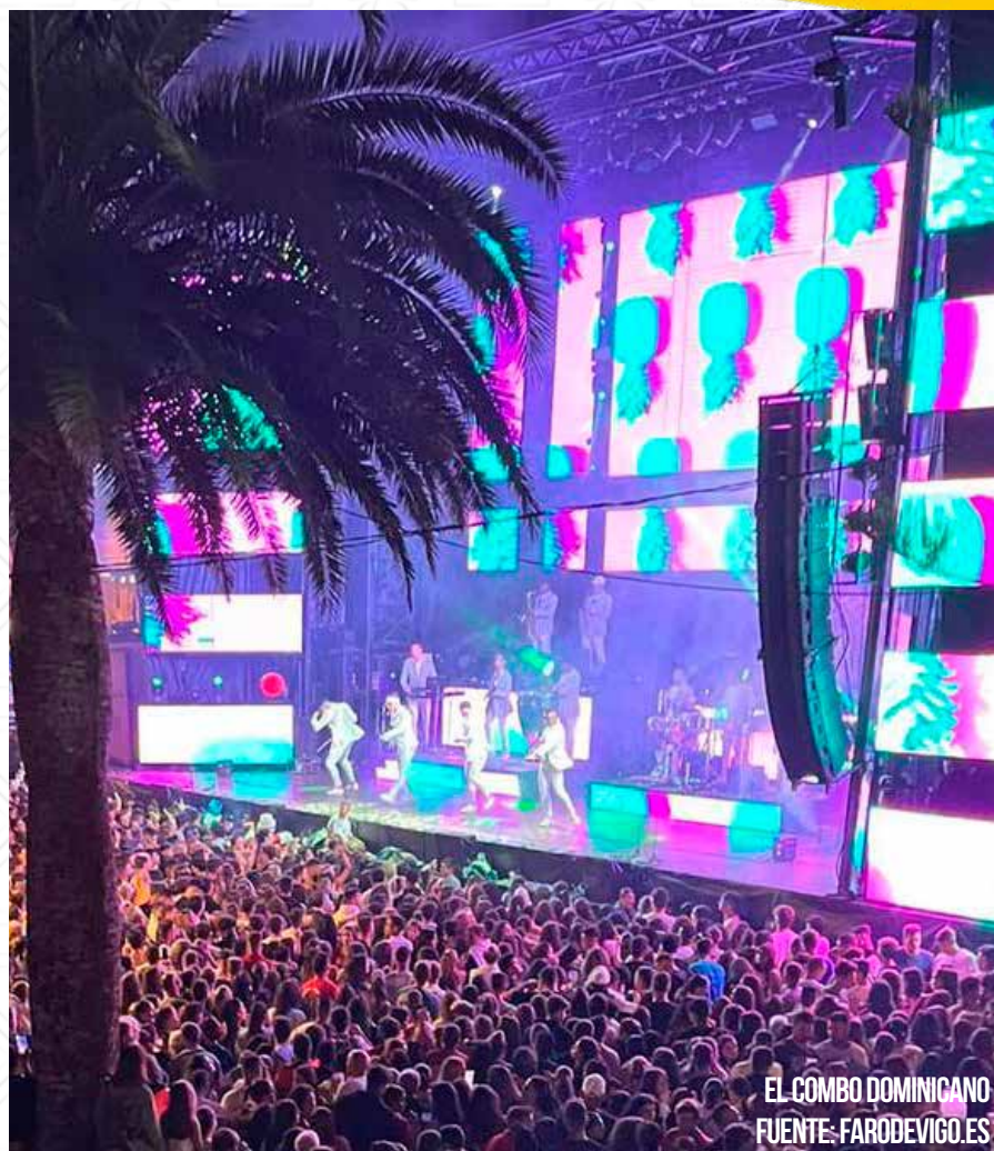
EL COMBO DOMINICANO

Tendrá lugar la verbena amenizada por la orquesta El Combo Dominicano.