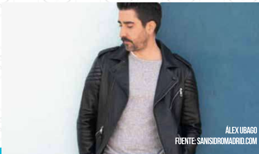
ÁLEX UBAGO

Río Córdoba) ya cuenta con una trayectoria de vértigo, más de 1.4 billones de streams, 15 discos de oro y 12 discos de platino.