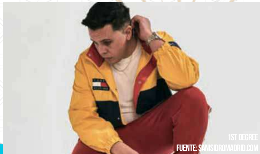
1ST DEGREE