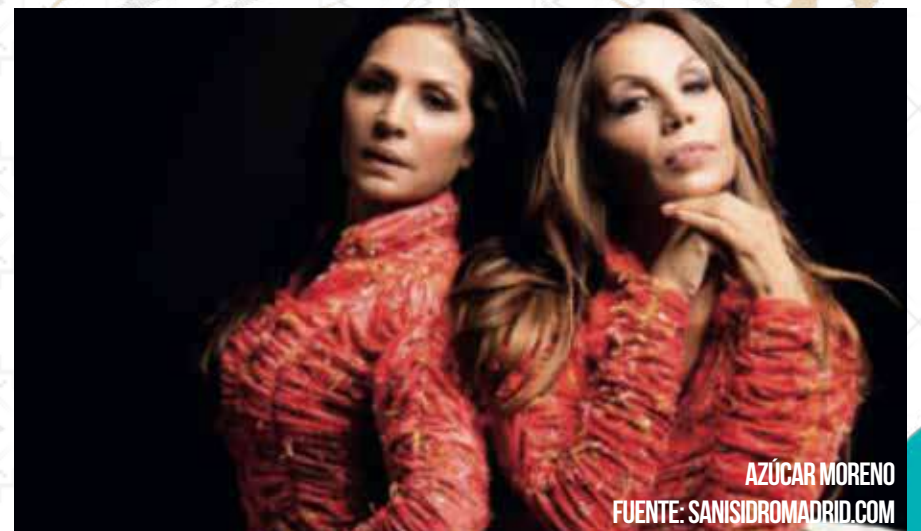
AZÚCAR MORENO