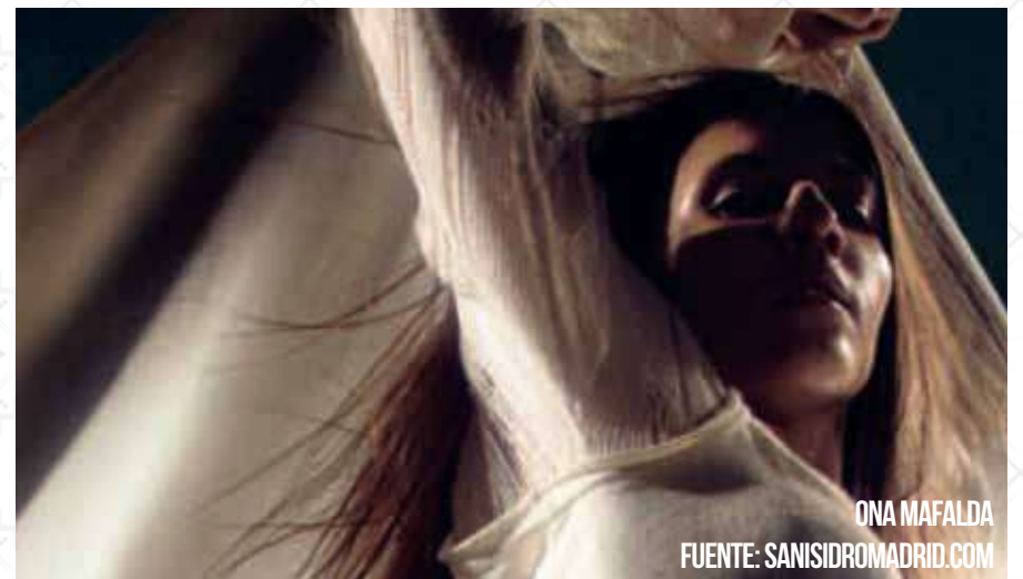
ONA MAFALDA

Las hermanas Salazar, Toñi y Encarna, uno de los dúos musicales más populares de nuestro país.