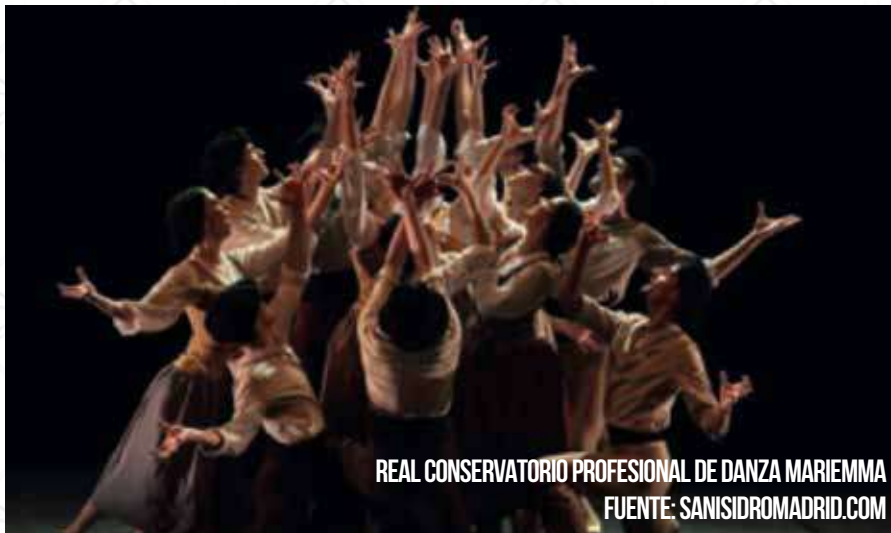
REAL CONSERVATORIO PROFESIONAL DE DANZA MARIEMMA

Representación de las especialidades de Danza Española y Danza Clásica.