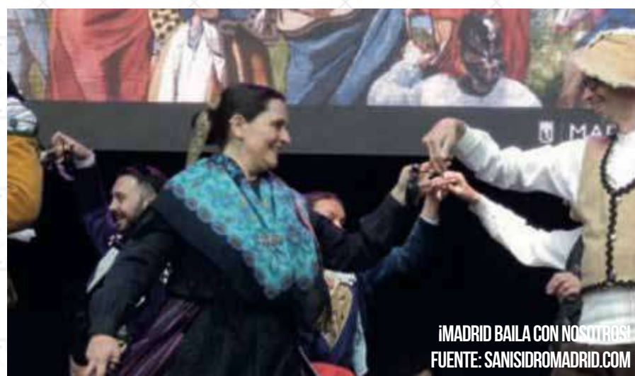
¡MADRID BAILA CON NOSOTROS!

La Plaza Mayor de Madrid, marco idóneo en el gran día festivo de San Isidro, recibirá la celebración del 40 FESTIVAL DE DANZAS MADRILEÑAS.