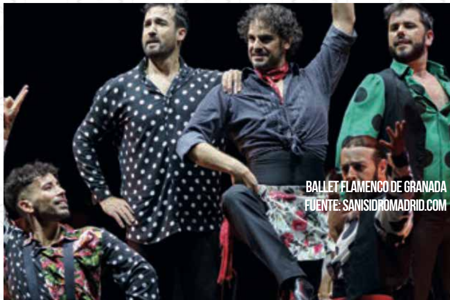
BALLET FLAMENCO DE GRANADA

Al ritmo de la música con la ayuda de parejas de Chulapos expertos del Chotis.