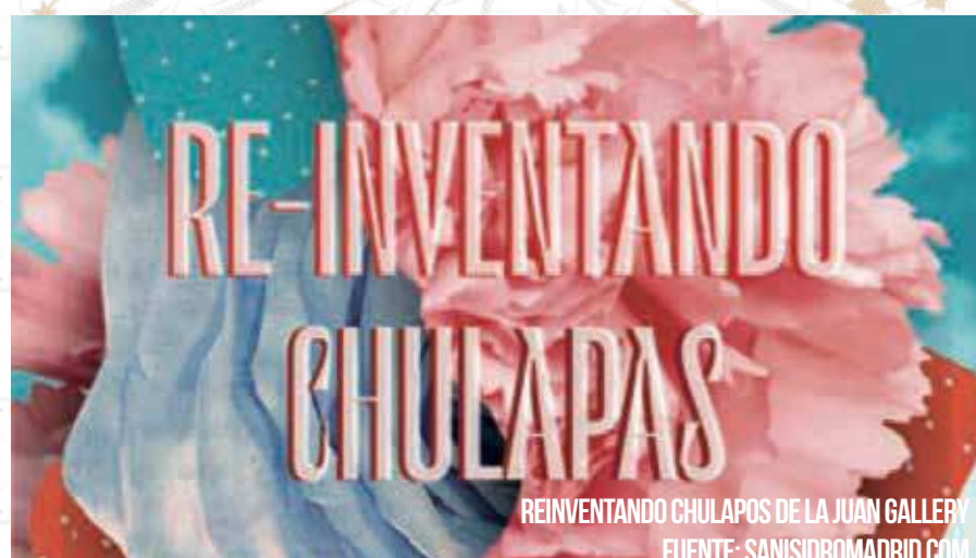
REINVENTANDO CHULAPOS DE LA JUAN GALLERY