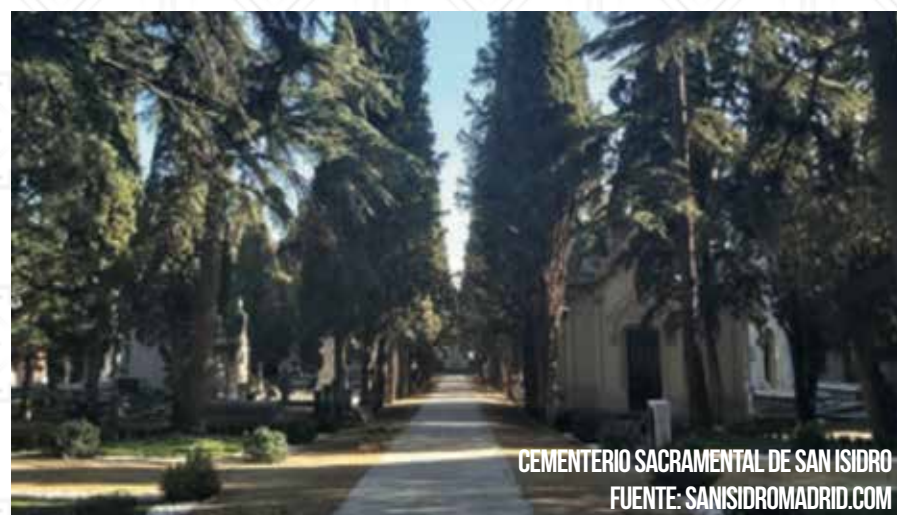
CEMENTERIO SACRAMENTAL DE SAN ISIDRO