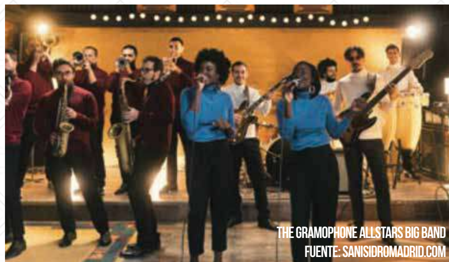
THE GRAMOPHONE ALLSTARS BIG BAND

Tras varios años de éxito y tres discos emble-