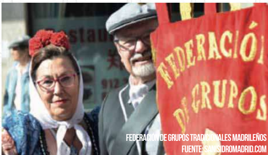
FEDERACIÓN DE GRUPOS TRADICIONALES MADRILEÑOS