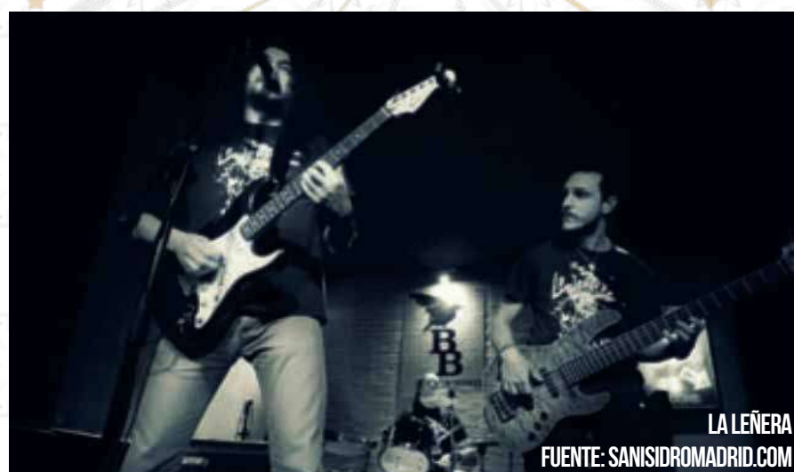
LA LEÑERA