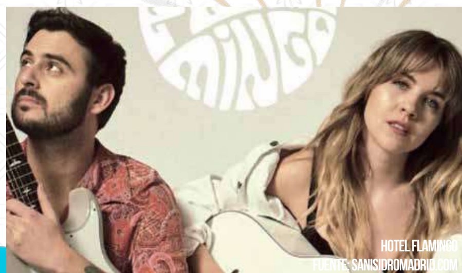
HOTEL FLAMINGO