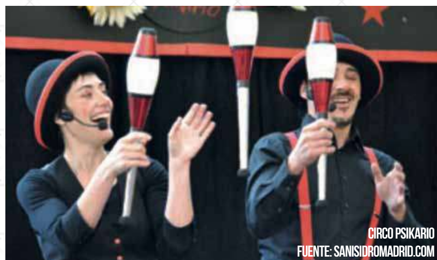
CIRCO PSIKARIO

Los cuatro integrantes de esta madrileña banda paladean y repasan, en un repertorio pegadizo, clásicos del pop-rock nacional e internacional.