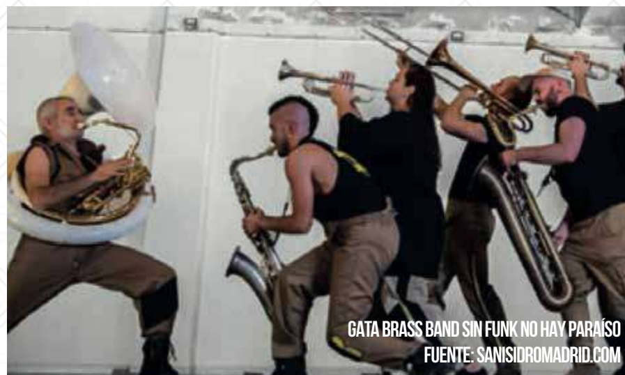
GATA BRASS BAND SIN FUNK NO HAY PARAÍSO