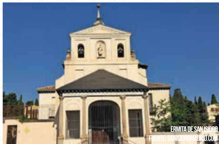
ERMITA DE SAN ISIDRO

El día 15 de Mayo se celebrarán dos Misas, a las 13h. y a las 17h. y permanecerá abier- tade9h. a14h.yde16.30h.a21h.