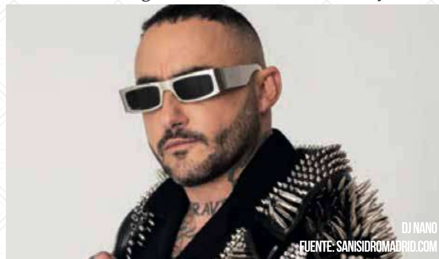
DJ NANO

Son una banda de andar por casa. Para empezar, salen al escenario en bata y zapatillas, emulando al Gran Lebowski, personaje de la película de los Cohen. Sonido guitarrero de alta calidad y com-