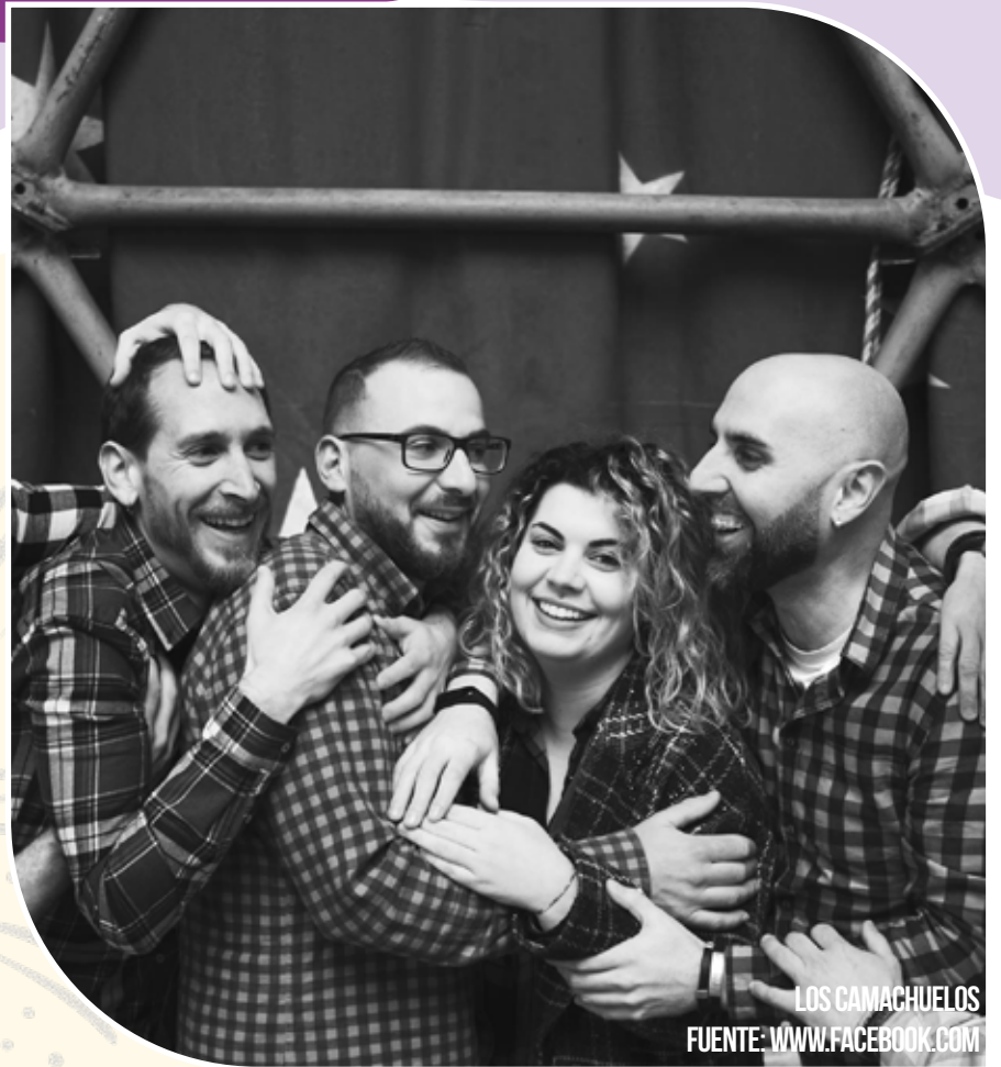
LOS CAMACHUELOS

El fin de fiesta estará a cargo de disco móvil LB.