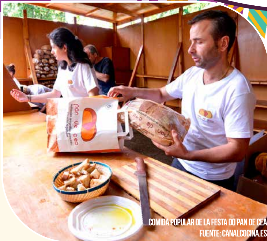
COMIDA POPULAR DE LA FESTA DO PAN DE CEA

El fin de fiesta estará animado por La Noria.