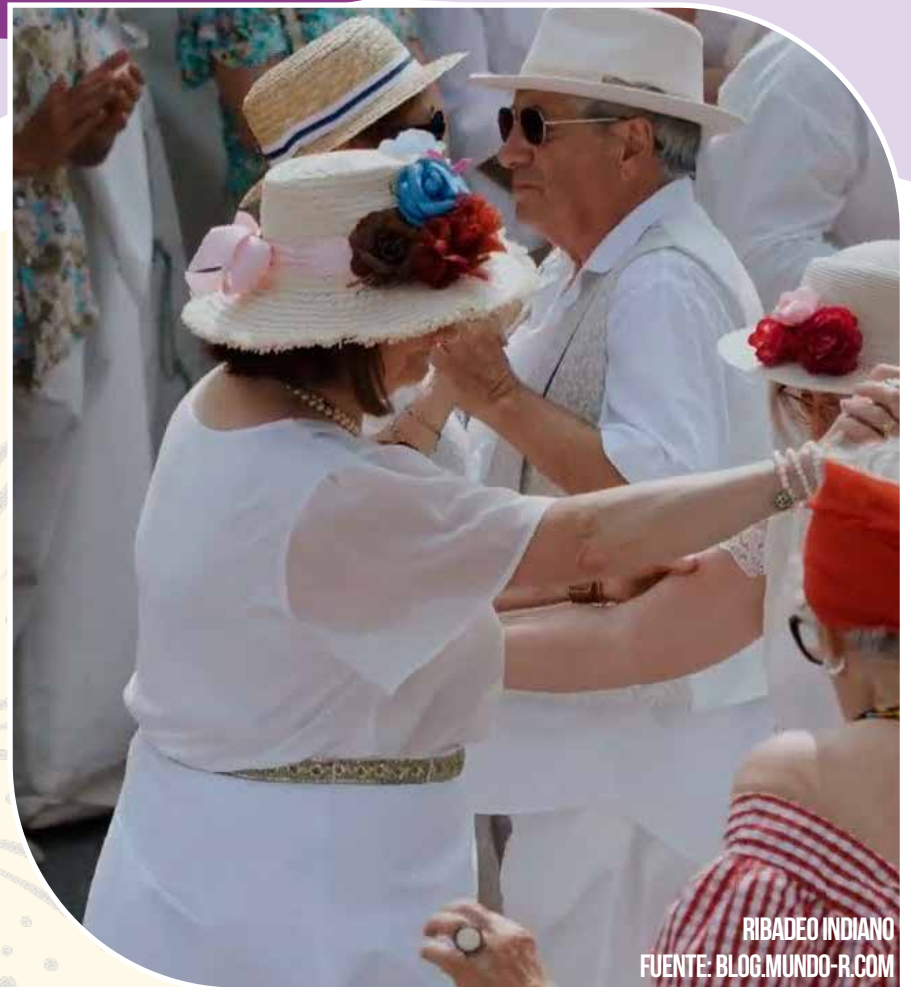
RIBADEO INDIANO

Quiosco de la música, Campo de San Francisco: verbena tradicional con los grupos Ninghures y Septeto Nabori.