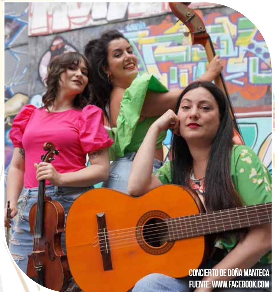
CONCIERTO DE DOÑA MANTECA FUENTE: WWW.FACEBOOK.COM