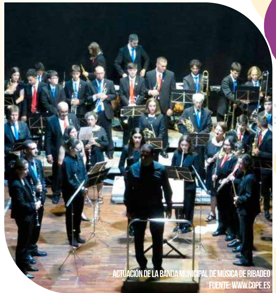
ACTUACIÓN DE LA BANDA MUNICIPAL DE MÚSICA DE RIBADEO