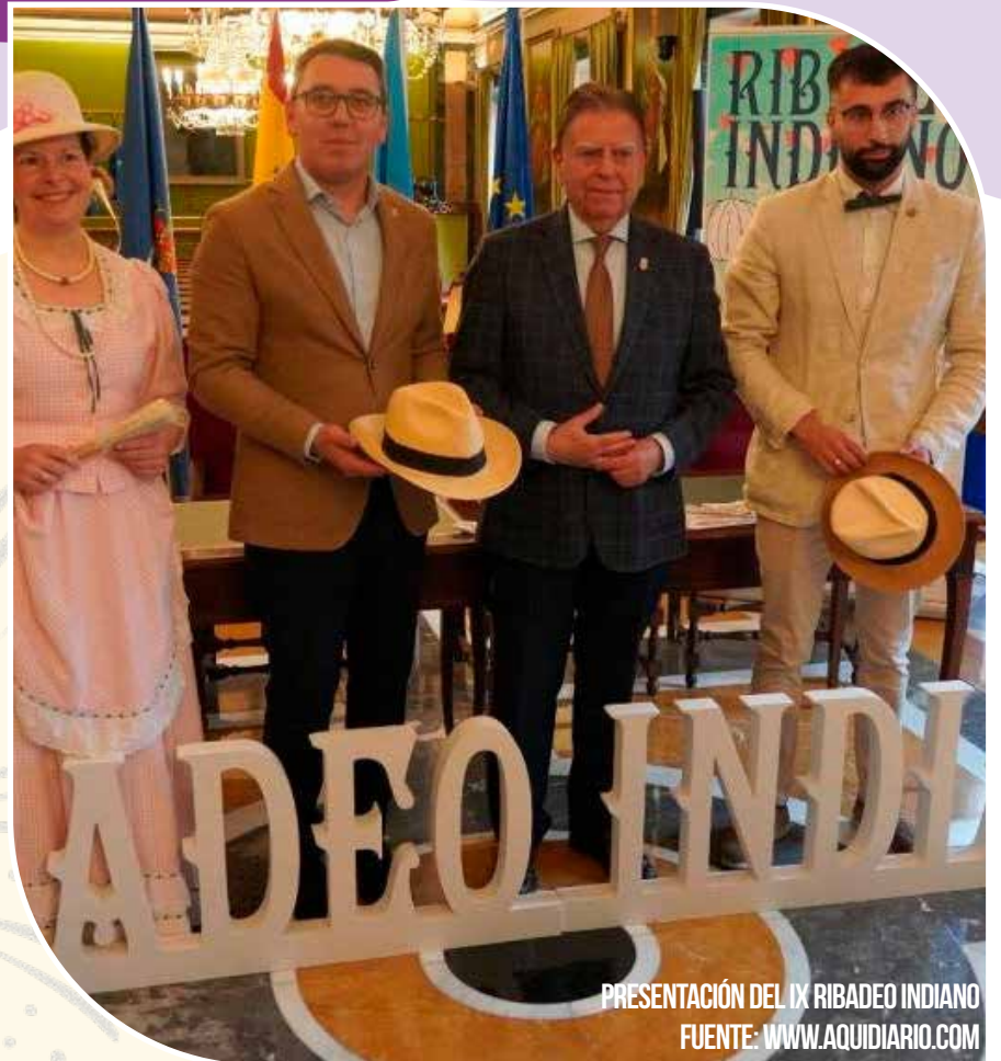
PRESENTACIÓN DEL IX RIBADEO INDIANO

Barrio San Roque: Mercado de Productos de Ultramar.