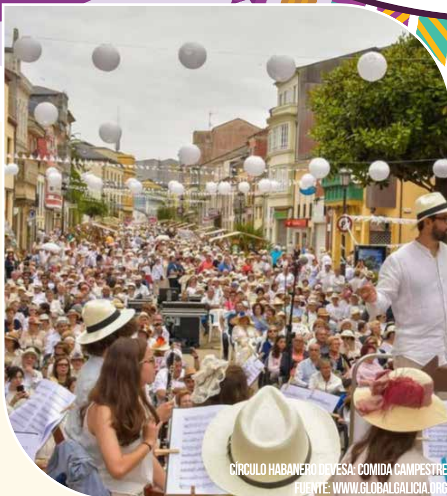
CÍRCULO HABANERO DEVESA: COMIDA CAMPESTRE

Barrio de San Roque: sorteo del viaje a Cuba.