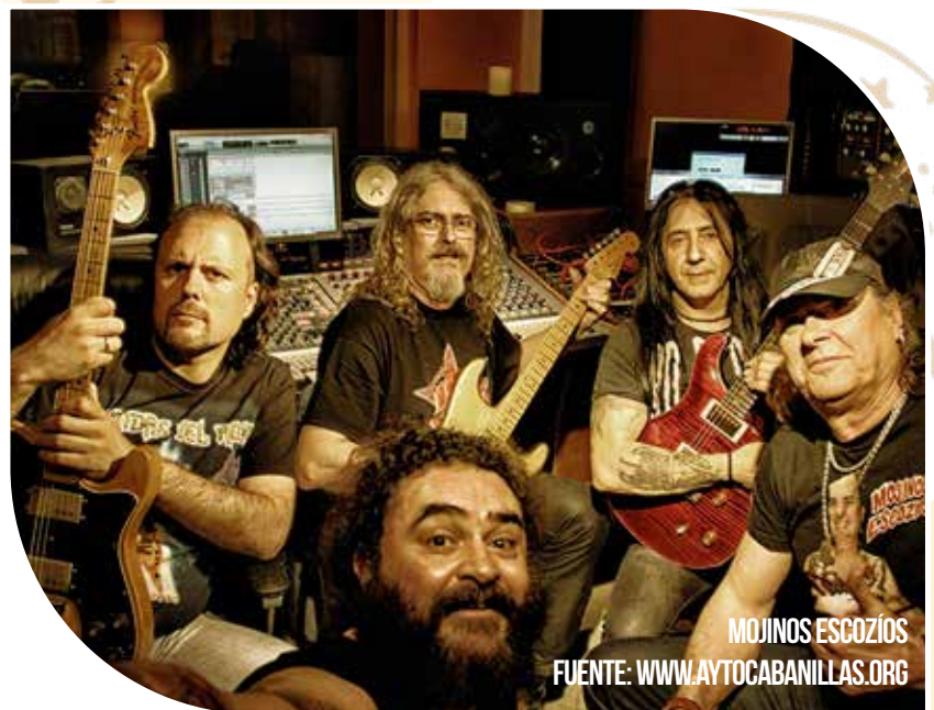
MOJINOS ESCOZÍOS

ROMERÍA a cargo de la Orquesta "LA REBELIÓN".