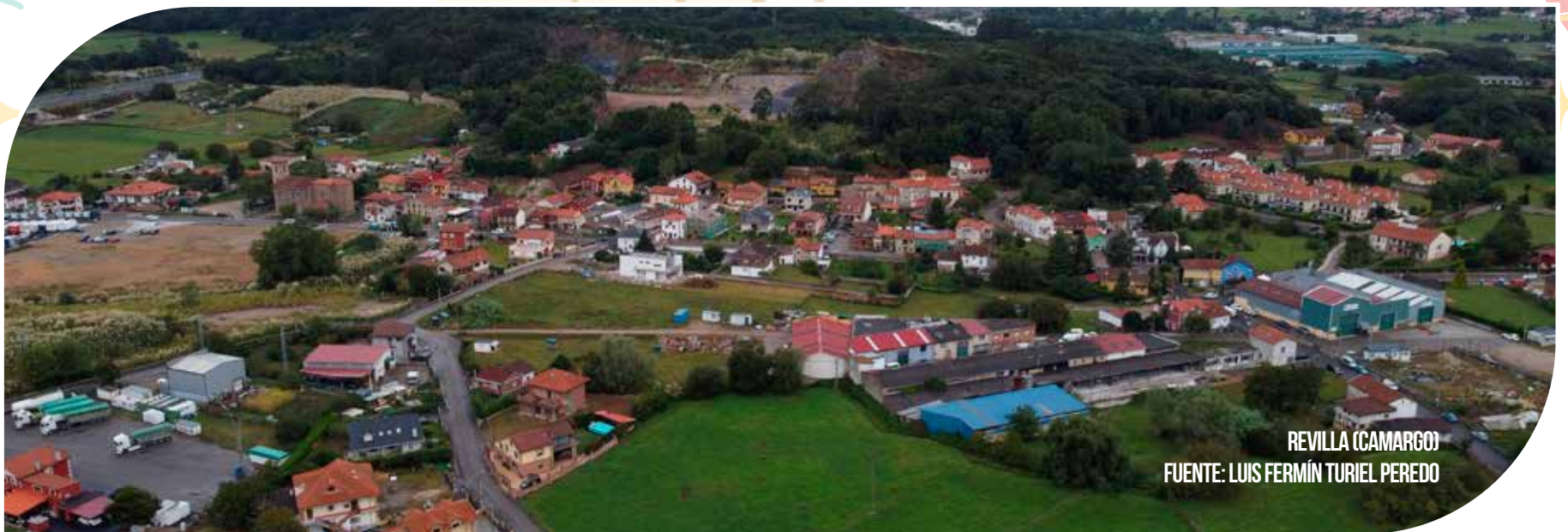
REVILLA (CAMARGO)

Gran Quema de Fuegos Artificiales . FIN DE FIESTA.