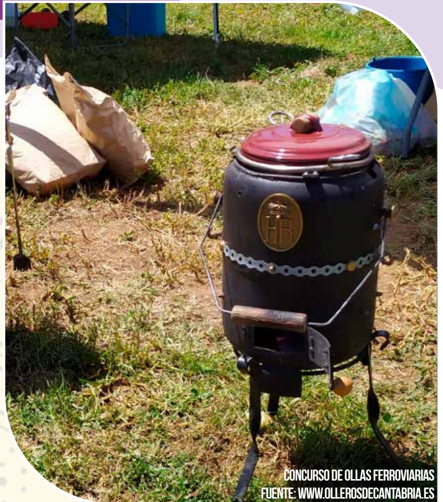
CONCURSO DE OLLAS FERROVIARIAS

A continuación degustación de una SALCHICHADA (bocadillo 1€). Colabora Supermercados LUPA Gran DISCO ROMERÍA a cargo de "PUZZLE".