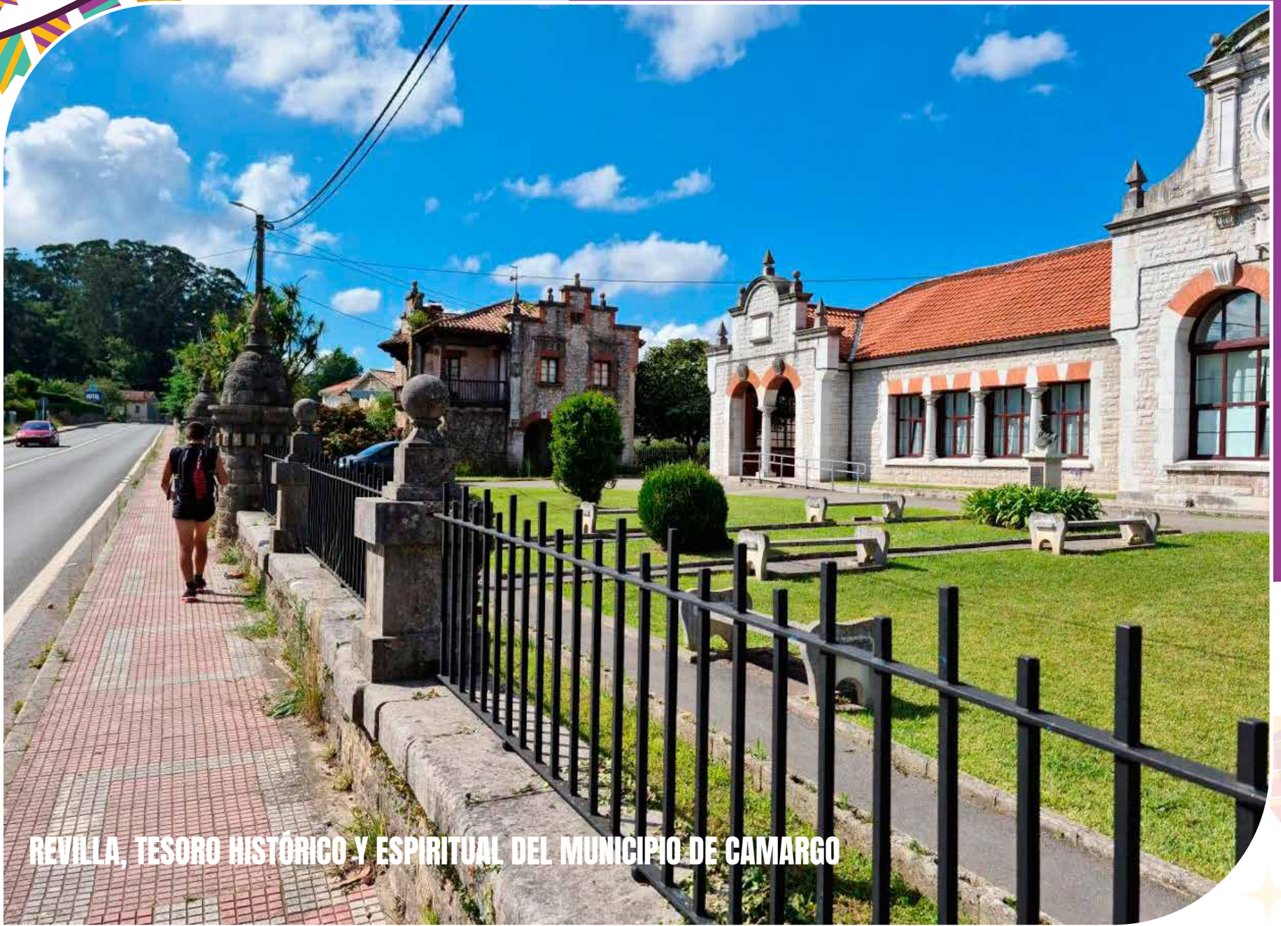
REVILLA, TESORO HISTÓRICO Y ESPIRITUAL DEL MUNICIPIO DE CAMARGO

Revilla, una encantadora localidad en el municipio de Camargo, Cantabria (España), no solo se destaca por su belleza natural y su ubicación estratégica, sino también por su rica historia y tradiciones arraigadas que han marcado profundamente la vida de sus habitantes a lo largo de los siglos.