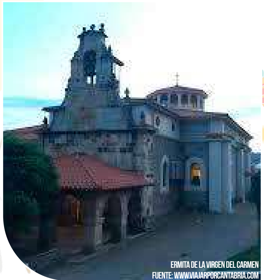
ERMITA DE LA VIRGEN DEL CARMEN