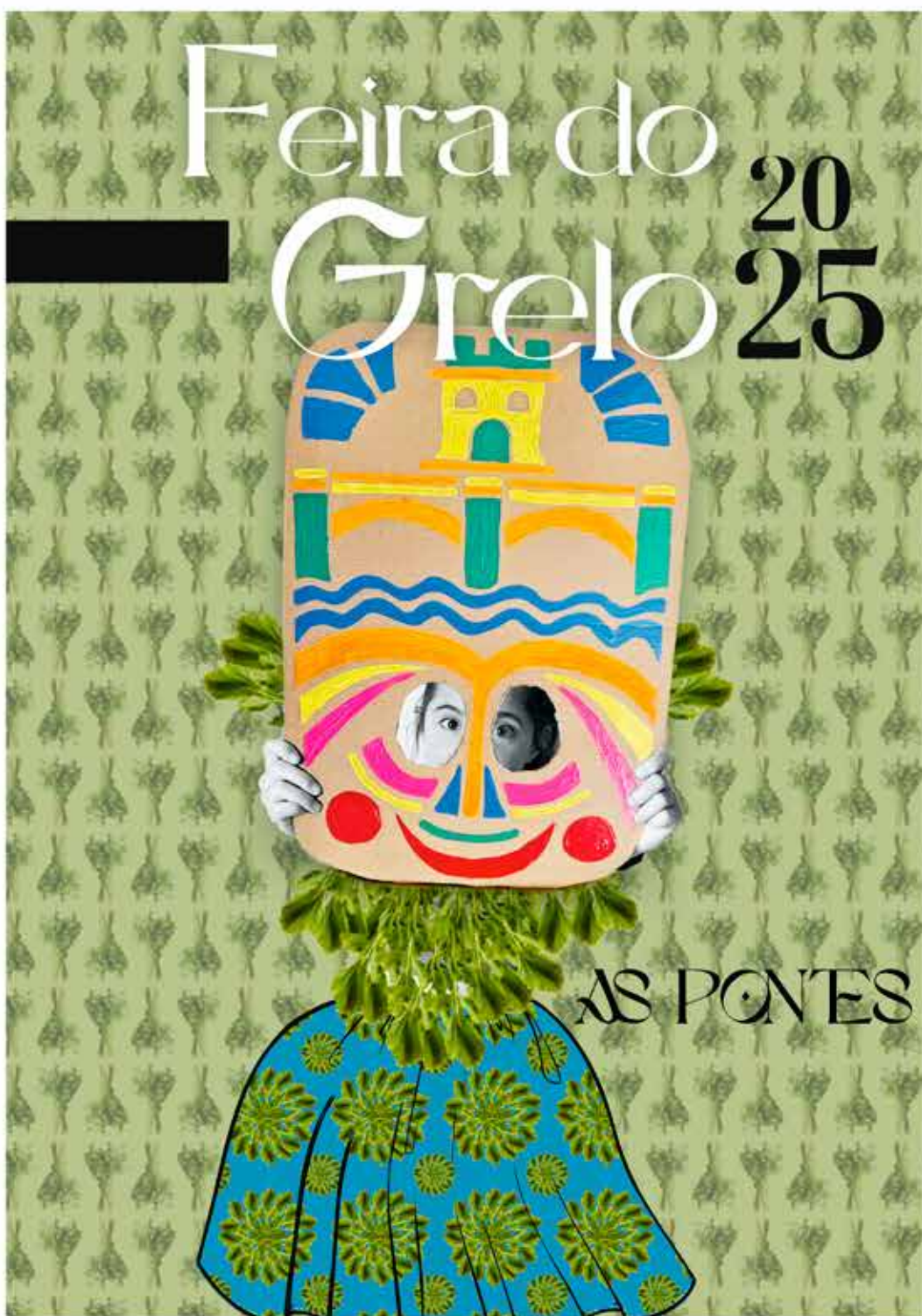
ana belén fazoz martel