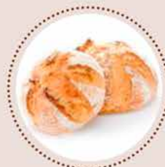
Pan de Hogaza