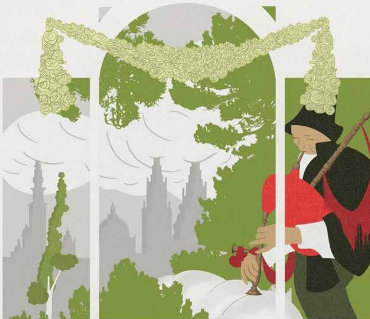
En Combriza a Castela, inspirado no seu cartaz das Festas do Apóstolo do 1912