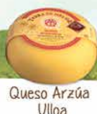
Queso Arzúa Ulloa

Orois - Melide (A Coruña) Tlf . 981 80 80 09