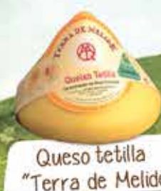
Queso tetilla "Terra de Melide"