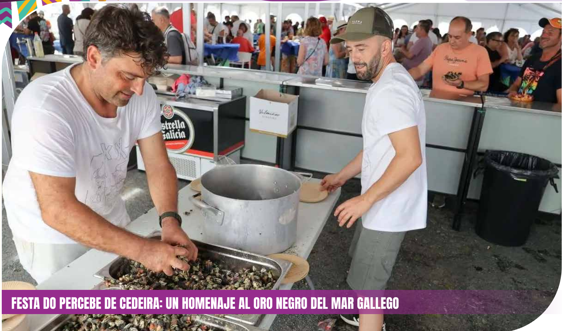
FESTA DO PERCEBE DE CEDEIRA: UN HOMENAJE AL ORO NEGRO DEL MAR GALLEGO

Cada verano, la villa marinera de Cedeira, en el norte de Galicia, se transforma en un punto de encuentro para los amantes de la buena mesa y las tradiciones del mar. La Festa do Percebe (Fiesta del Percebe) se ha consolidado como uno de los eventos gastronómicos más destacados de la región, rindiendo homenaje a uno de los mariscos más apreciados y valorados: el percebe.