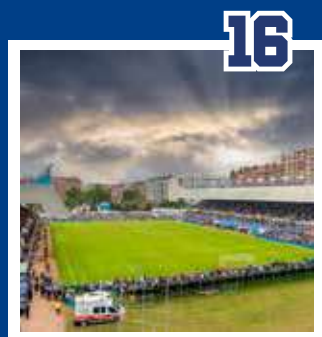
REAL AVILÉS INDUSTRIAL - RACING DE FERROL